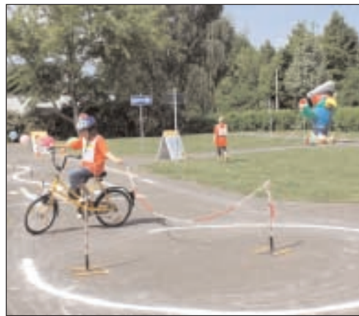
Neben theoretischen Kenntnissen mussten die Schüler in der Praxis auch ihre Geschicklichkeit beweisen. Mit einer Hand im Kreis fahren oder über ein kleines Verkehrshindernis kommen.