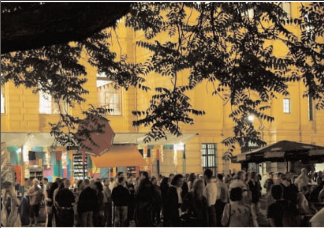
Höhepunkt des nächtlichen Treibens am Lindenau-Museum in Altenburg wird um 21:00 Uhr die Ausstellungseröffnung „Oskar Kokoschka und die Antike“ sein.

linienbusse. Mit freundlicher Unterstützung von: Osterländer Volkszeitung, EWA Energie- und Wasserversorgung Altenburg GmbH, Thüsic Personennahverkehrsgesellschaft mbH Sitz Altenburg