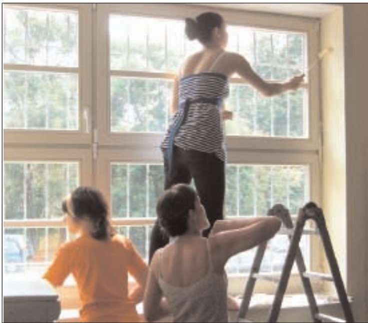
Schüler der Dietrich-Bonhoeffer-Schule und vom Lerchenberggymnasium halfen dabei, dass die Räume im Jugendtreff Rote Zora in Altenburg einen neuen Farbanstrich erhielten.