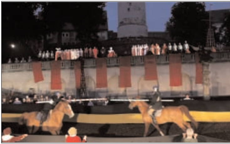
Auszug aus dem Stück des Altenburger Prinzenraubes im vergangenen Jahr.

der- und Jugendcamp in Naundorf (bis 07.07.2010), Naundorf