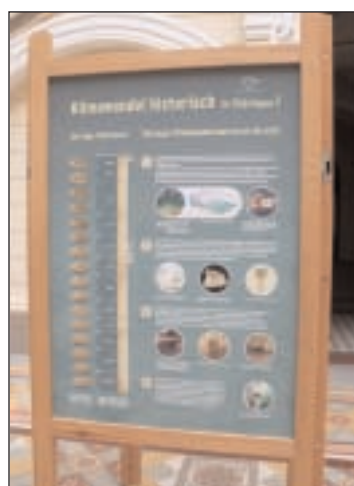
Wissenswertes rund ums Klima im Freistaat liefern die 18 Schautafeln.

Einen solchen Beitrag hat der Kreistag des Landkreises Altenburger Land bereits 2005 mit der stärkeren Nutzung erneuerbarer Energien im Landkreis beschlossen. Doch Klimawandel hat auf viele Bereiche des Lebens Auswirkungen, nicht nur auf den Energiesek-