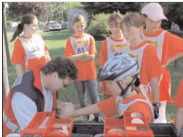
Durch das Deutsche Rote Kreuz bekamen die Teilnehmer wichtige Einblicke in Fragen der Ersten Hilfe.

Ein besonderer Dank gilt an dieser Stelle den Sponsoren, vor allem der THÜSAC-Personenverkehrs-gesellschaft mbH, die jährlich einen Beitrag zu dieser Verkehrssicherheitsarbeit leistet. SiMa