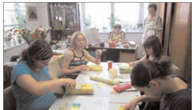
Schüler vom Lerchenberggymnasium Altenburg halfen den Mitgliedern vom Regionalverband des Bundes der Vertriebenen beim Geschenke packen anlässlich ihres 20-jährigen Bestehens.