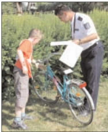
Was an ein verkehrssicheres Fahrrad gehört, wurde an dieser Station gefragt.