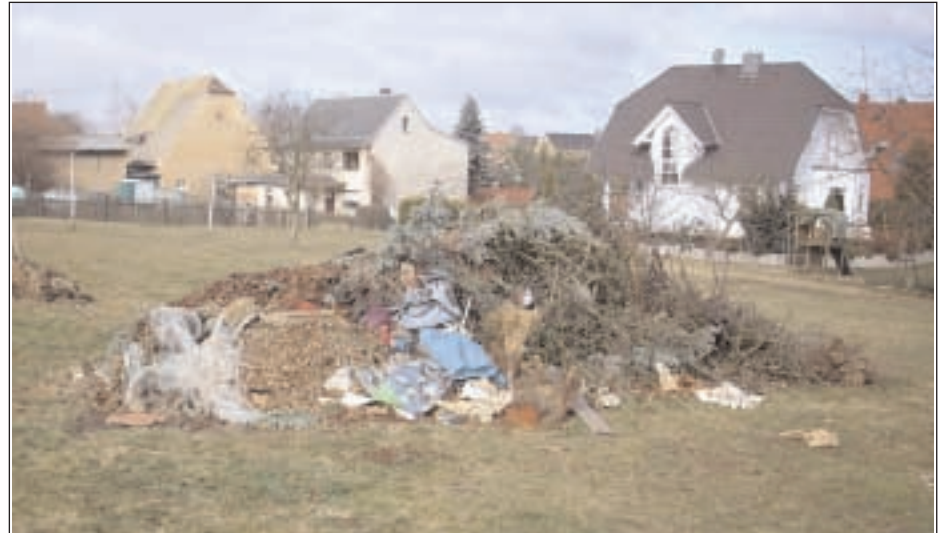
Eines der größten Probleme während des Verbrennungszeitraumes stellt das Anzünden von nichtzulässigem Material dar, wie hier auf einem Grundstück in Zschöpperitz.