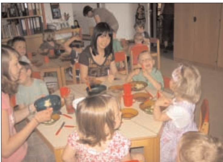
Ehrenamtliche Kinderbetreuung übernahmen Schülerinnen des Lerchenberggymnasiums im Magdalenenstift in Altenburg. Dabei halfen sie den Jüngsten u. a. beim Mittagessen oder beim An- und Ausziehen.