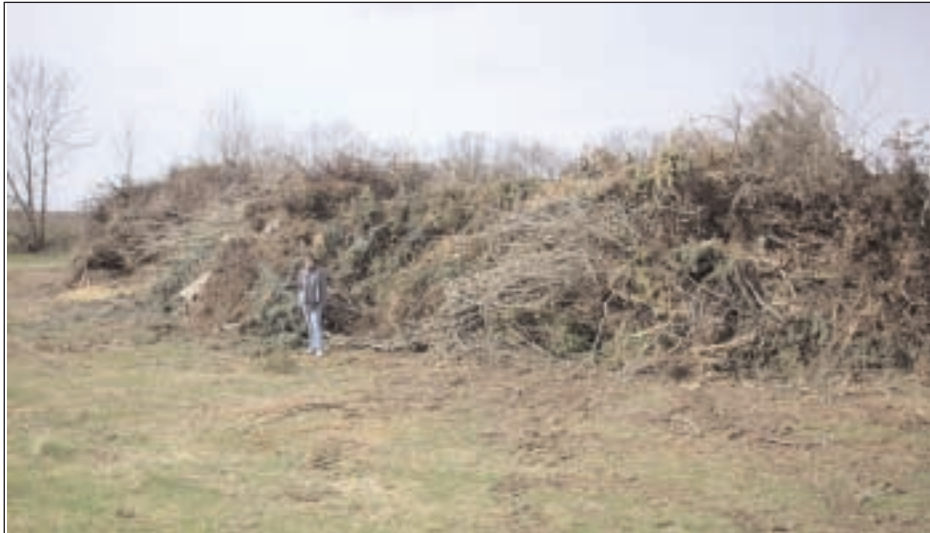
Mit Brauchtumpflege hatte das letzte Osterfeuer in der Gemeinde Starkenberg nur wenig zu tun, da hier eindeutig nicht die Brauchtumpflege, sondern eher die illegale Abfallentsorgung im Vordergrund stand.