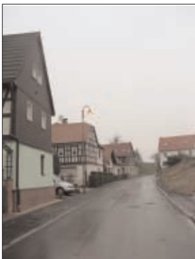
Die Straße im sanierten Zustand

Weiterhin konnte in einer Gemeinschaftsmaßnahme mit der envia Verteilnetz GmbH (enviaM) und durch die Koordination mit den Straßenbauarbeiten zum Ausbau der Ortsdurchfahrt Selleris in der gesamten Ortslage die alten Freileitungen der Stromversorgung und der Straßenbeleuchtung zurück gebaut und mittels Erdkabel erneuert werden. Die alte Trafo-Maststation und die Zähler-/Anschlussäule der Straßenbeleuchtung wurden durch Anlagen nach neuestem Stand der Technik ersetzt. In allen Verkehrsanlagen erfolgte die Errichtung dekorativer Leuchten mit hoher Lichteffizienz. Als bauausführende Firmen waren die KADUR Elektrotechnik aus Schmölln, die Windolph Bauunternehmung GmbH aus Leipzig-Mölkau und die EUROVIA Verkehrsbau Union GmbH aus Leipzig-Markranstädt tätig. Für die Planung zeichnete das Planungsbüro für Elektroanlagen M. Feiler aus Al-