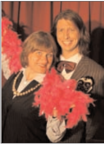
Wie wäre es mit einem Besuch des Gößnitzer Kabarettes "Nörgelsäcke"