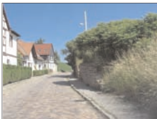
Die Straße vor Beginn der Baumaßnahmen

Bis vor kurzem befand sich die Straße in Selleris in einem sehr schlechten baulichen Zustand. Zudem ist im Jahr 2009 eine beträchtliche Verschlechterung des Straßenzustandes infolge des Umleitungsverkehres der Vollsperrung der B 93 in Mockern eingetreten. Zur Verbesserung der Verkehrsverhältnisse in der Ortslage