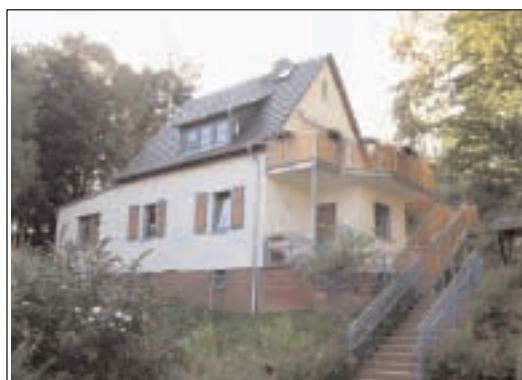
Am Rande des Ortsteils Podelwitz befindet sich in idyllischer Lage neben einem kleinen Bach unsere Kindertagesstätte "Sonnenschein"

Im Rahmen der Dorferneuerung und -entwicklung fördert das Amt für Landentwicklung und Flurneueordnung das Projekt der Erneuerung der Straßenbeleuchtung mit 65 % der Gesamtausgaben. Am 1. Dezember wurde die Straße für den Verkehr wieder freigegeben.