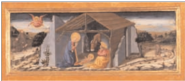
Neri di Cicci (1418-1492): Geburt Christi. Um 1470-1480

Bernhard von Lindenau (1779 - 1854) schenkte im 19. Jahrhundert seiner Vaterstadt Altenburg ein Museum. Dessen kostbarster Schatz ist eine der weltgrößten Sammlungen früher italienischer Malerei. Seit mehr als 160 Jahren wird sie in Altenburg präsentiert.