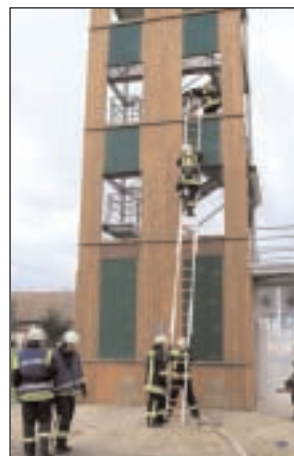
Steigerturm in Burkersdorf

Wir bieten: - eine hochwertige Ausbildung als