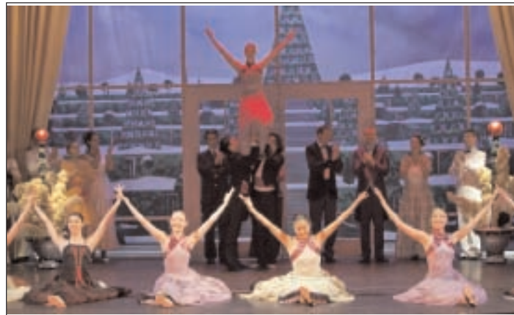
Ausschnitt aus der Operette „Die Csárdásfürstin“

Die Musik-Komödie „Mama hat den Blues und Papa möchte feiern“ steht am Montag, 27. Dezem-