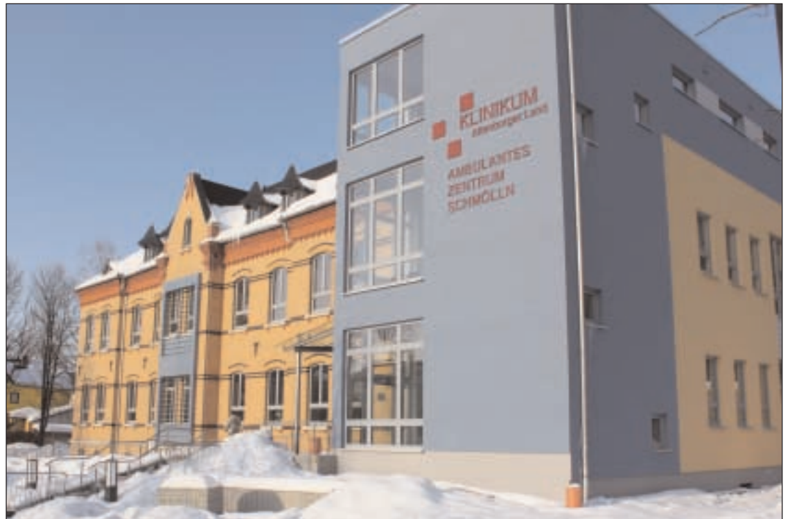
Gelungene Verbindung zwischen Alt und Neu: Der ehemalige Klinikbau an der Robert-Koch-Straße in Schmölln wurde mit einem modernen Anbau versehen.