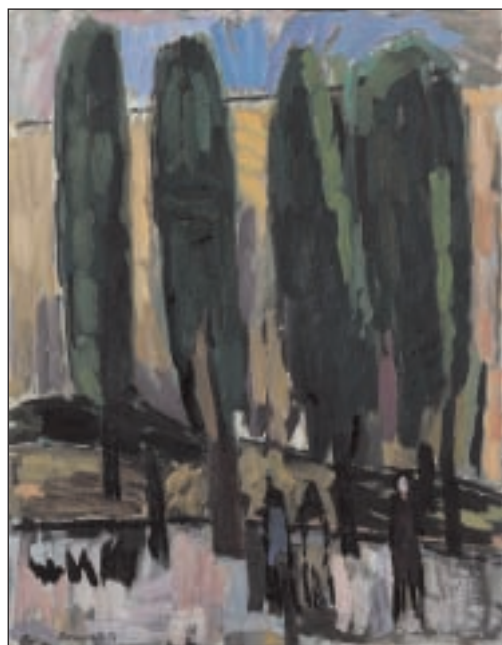
Klaus Roenspieß, Pappeln, 1997, Öl auf Leinwand

Altenburg. Das Lindenau-Museum Altenburg eröffnet am Sonntag, 23. Januar, 14:00 Uhr , eine Sonderausstellung mit dem Titel "Aus der Sammlung Frotz. Eine Schenkung".