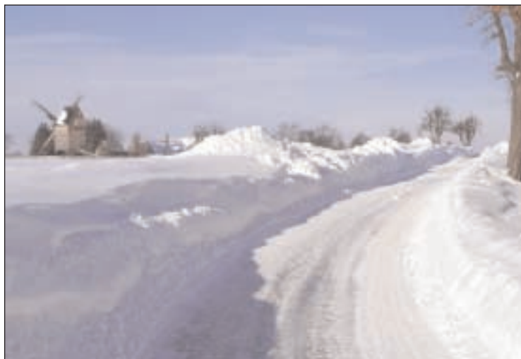
Kreuzstraße K 528 zwischen Kleintauscha und Hartha