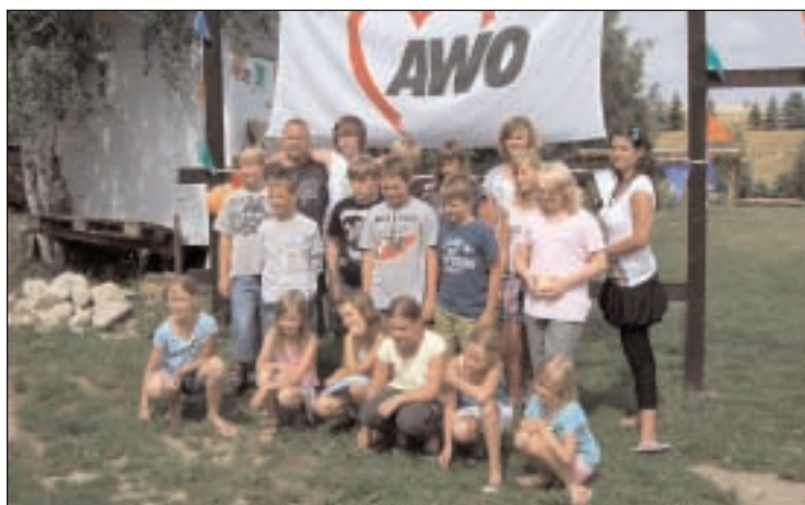
Teilnehmer des Jugendcamps im vergangenen Jahr

Der AWO Kreisverband Altenburger Land e. V. bietet in diesem Jahr sein 11. Feriencamp „Für Gewaltlosigkeit und Umwelt“ an. Neben drei Ausfahrten werden Aktivitäten wie Baden, Sport, Spiel und Basteln nicht zu kurz kommen. Spannung erlebt ihr zur Nachtwandlung und bei Naturführungen ebenso wie beim Fuß- und Volleyball-