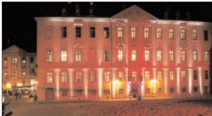
In stimmungsvollem Ambiente zeigt sich der Schlosshof

Zuvor schlägt das Museum einen Bogen in das 140-jährige Landestheater und eröffnet die Ausstellung „Stephan Walz. Theaterfotografie“.