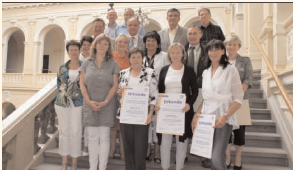
Zahlreiche Schulen konnten die Urkunde zur erfolgreichen Teilnahme am im Jahr 2003 initiierten Projekt Energie-Sparen an Schulen bereits zum 8. Mal entgegennehmen

Fester Bestandteil der Schulleiter- konferenz ist die jährliche Auswer- tung des Projektes „Energie-Spa- ren an Schulen“, das seit dem Schuljahr 2002/2003 an den Schu- len im Altenburger Land erfolg- reich umgesetzt wird. Ziel des Pro- jektes ist es, durch eine Verände- rung des Nutzerverhaltens der Schüler und Lehrer zu erreichen, dass Elektro- und Heizenergie ein- gespart und somit Kosten und Um- weltbelastung gesenkt werden.