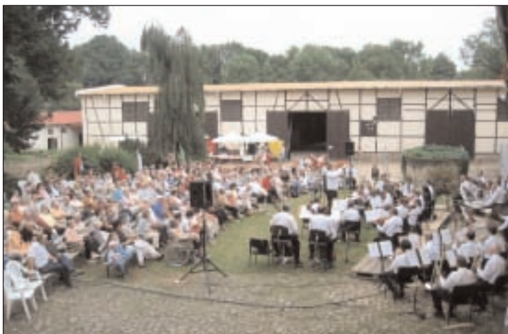
Das Bauernhofkonzert auf dem Rittergut Schwanditz erfreute sich im vergangenen Jahr großer Beliebtheit

Mit beliebten und bekannten Melodien aus Oper, Operette und Musical wird im Programm für jeden Geschmack und jedes Alter etwas dabei