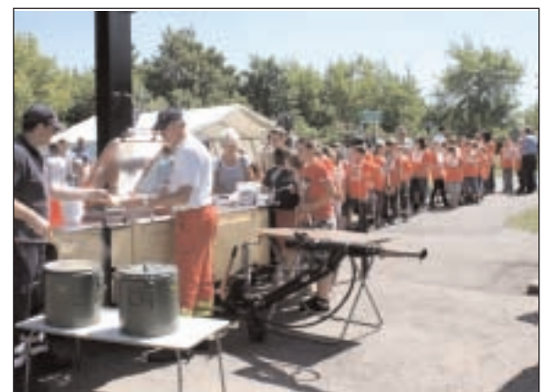
Alle Schülerinnen und Schüler sowie die Organisatoren wurden durch die Helfer der Johanniter-Unfall-Hilfe e. V. bestens versorgt