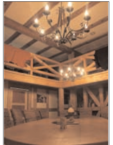
Blick in die Straußenscheune