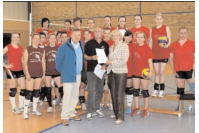
Übergabe des symbolischen Schecks an den Volleyballclub Altenburg