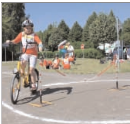
Gar nicht so einfach - Geschicklichkeit mussten die Kinder auf dem Hindernisparcours nachweisen