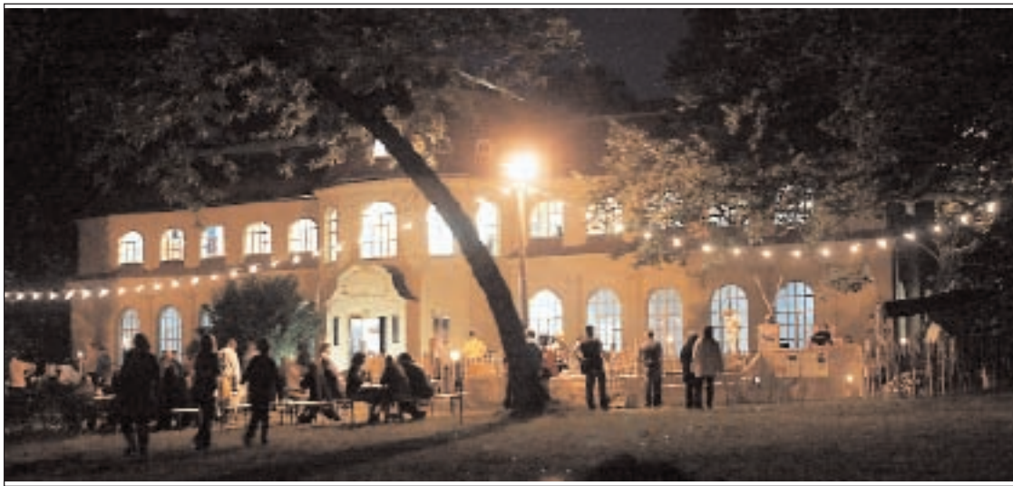
Zur diesjährigen Museumsnacht ist im Mauritanium viel Wissenswertes über Afghanistan zu erfahren

Eine Vielzahl von Sonderausstellungen öffnet das Schloss- und Spielkartenmuseum auch zur Museumsnacht. Besonderheiten einiger Ob-