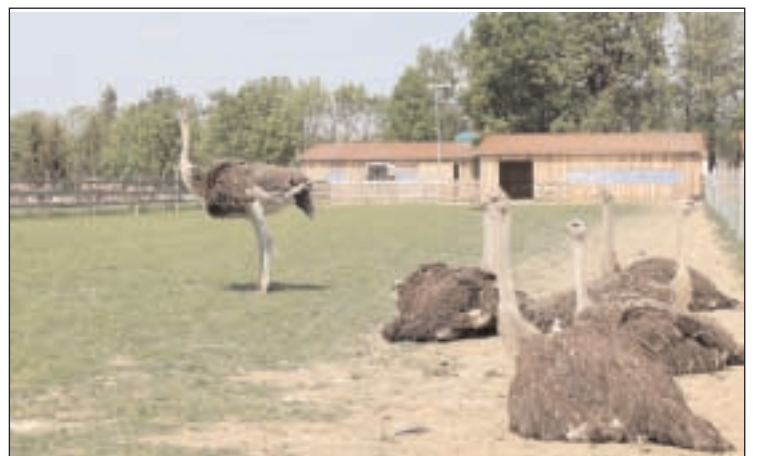
Vier Hektar umfasst das gesamte Gelände der Farm