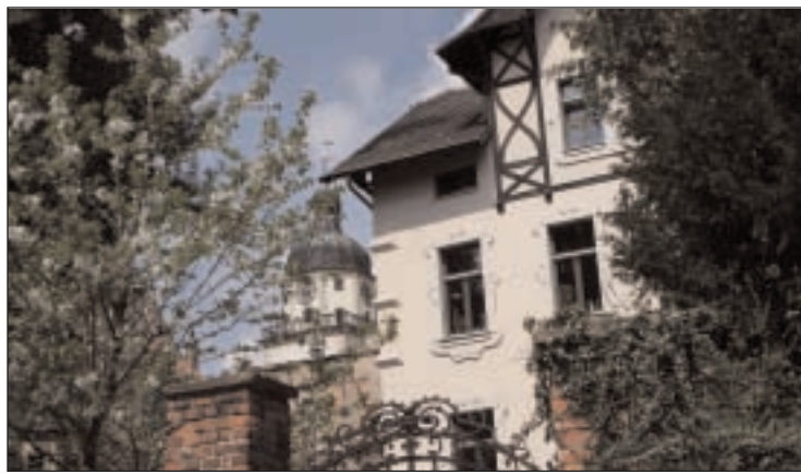
Idyllische Fotomotive sind im Rahmen des Fotografie-Kurses zu entdecken

Erleben Sie, wie einfach es ist, frei und phantasievoll aus einem vorbereiteten Holzstück einen kleinen Kopf zu schnitzen. Nach einer Einführung in Material und Technik der