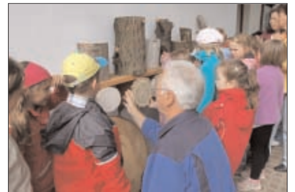
„Kleine Baumkunde“ - Welches Holz gehört zu welcher Baumart?