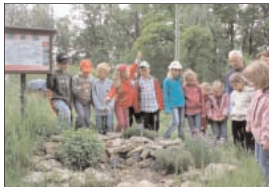
Im Kräutergarten lernen die Erstklässler verschiedene Kräuter kennen und kosten frischen Schnittlauch