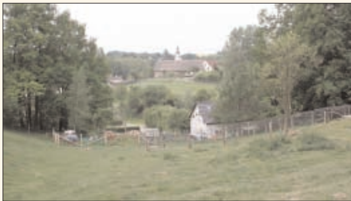
Blick auf die Naturschutzstation Grünberg (rechts)

Altenburg. Mit dem „Langen Tag der Natur“ möchten der NABU Thüringen und die Stiftung Naturschutz Thüringen gemeinsam mit anderen Akteuren und Partnern Menschen für die kostbaren Naturschätze im Land begeistern. Am 24. und 25. Juni haben naturinteressierte Bürgerinnen und Bürger die Möglichkeit, die Vielfalt der heimischen Natur intensiv zu erleben. Der Landschaftspflegeverband Altenburger Land e. V. beteiligt sich am „Langen Tag der Natur“ und führt folgende Veranstaltungen durch: