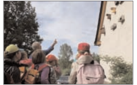
Die Nistkästen sind gerade mit Sperlingen, Rotschwänzchen und Mauerseglern bewohnt.