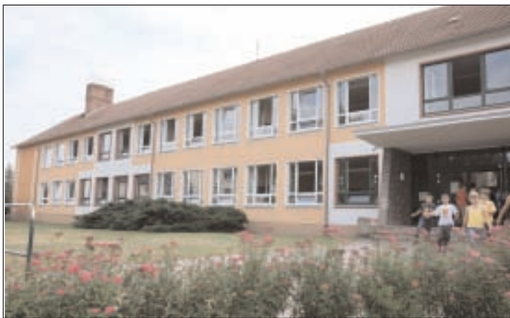
Durch den Landkreis werden ca. 44.000 Euro in die Herstellung des baulichen Brandschutzes und in die Erneuerung der elektrischen Anlagen in der Wieratalschule in Langenleuba-Niederhain investiert

Der Landkreis hat im Jahr 2011 weitere Investitionen an den Schulgebäuden geplant, für die im Kreishaushalt ca. 730.000 € zur Verfügung stehen. Um alle Wünsche der Schulleiter erfüllen zu können, ist dieser Betrag leider nicht ausreichend, es ist jedoch damit möglich, einige in den vergangenen Jahren aufgeschobene Leistungen endlich umsetzen zu können. So sollen in diesem Jahr die 2009 begonnenen und im Rahmen der Sportstättenförderung vom Freistaat Thüringen