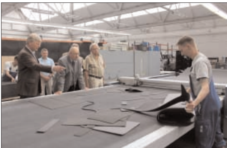
Einlegematten werden für nahezu alle Automobilhersteller produziert und modellspezifisch zugeschnitten