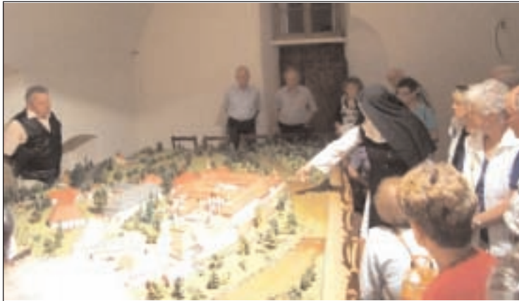
Auch ein Besuch des Klosters Marienthal gehörte zum Programm. Eine Nonne informierte die Seniorenbeiräte über die Klosteranlage.

eine Physiotherapie sind im Mehrgenerationenhaus vorhanden. Außerdem gibt es ein Servicebüro als zentrale Anlaufstelle für alle Bewohner. Auch der neu gestaltete Innenhof inklusive Grillplatz, Spielgeräten und Sitzgelegenheiten bietet allen Bewohnern Möglichkeiten, miteinander Freizeit zu verbringen. Die Mitglieder der Seniorenbeiräte waren vom Mehrgenerationenhaus