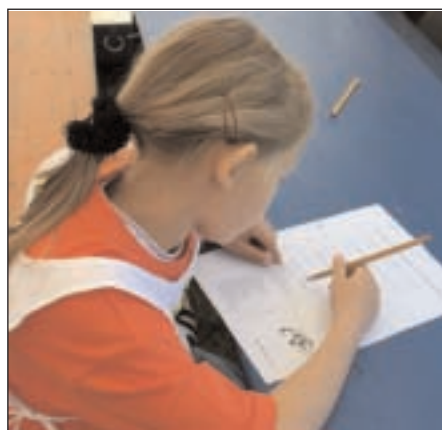
Regelkunde rund ums Fahrrad und um das Verhalten im Straßenverkehr war beim theoretischen Wissenstest gefragt