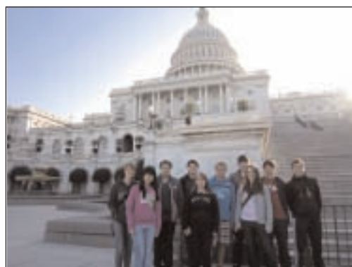
Die Schülerinnen und Schüler des Lerchenberggymnasiums vor dem Capitol in Washington, D.C.

halt in Baltimore ging es zurück nach New York. Den Time Square bei Tag und bei Nacht zu erleben, war etwas ganz besonderes. Zur New York-Tour gehörten aber auch der Central Park, die Fifth Avenue und der Financial District mit der Wall Street. Auch Ground Zero durfte nicht fehlen. Zurück in Hickory wurden abschließend das Police und Fire Department der Partnerstadt besucht. Die Schüler freuen sich bereits jetzt auf den Gegenbesuch der