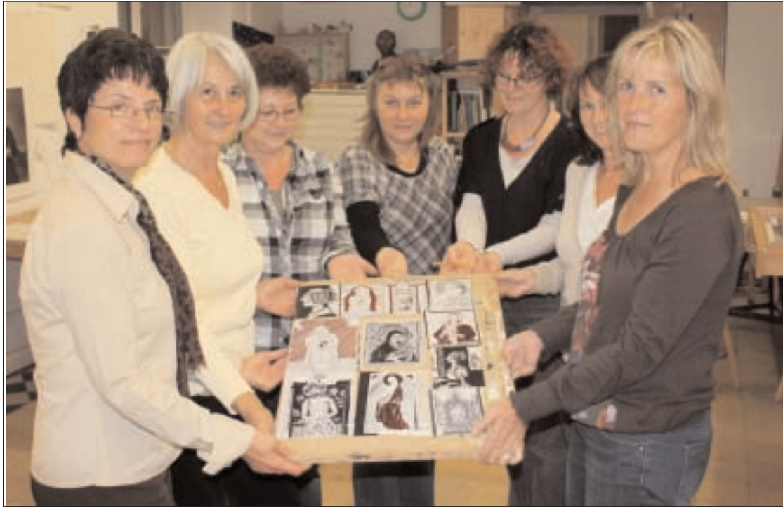
Teilnehmerinnen der Malerei/Grafik-Gruppe, die von Gerd Rödel geleitet wird

Gleich zu Beginn des Festes wird die Ausstellung „Im Kabinett: Dozenten des Studios“ eröffnet, bei der die „Lehrmeister“ einige ihrer selbst gestalteten künstlerischen Arbeiten präsentieren. Zudem gibt es im Museum Kunststationen zum Sehen, Hören und Mitmachen, begleitet von musikalischen Szenen aus Camille Saint-Saens „Der Karneval der Tiere“ und dargeboten vom Ensemble des Osterländer Musikbundes e. V. Darüber hinaus wird die Siebdruckedition „Mein Museumsblick“ präsentiert. Wer möchte, kann sich auch einer Führung durch die Ausstellung „Fioritura – Blütezeiten der Majolika“ anschließen und über 500 Jahre alte außergewöhnlich schön bemalte Gefäße bewundern. Spannung und Atmosphäre verspricht der geplante Rakubrand hinter dem Museum. Dabei werden mit einer speziellen in Japan entwickelten Brenntechnik in den letzten Wochen im Studio getöpferte Arbeiten gebrannt. Unter dem Titel „Kugelmenschen“ ist ab 18:00 Uhr schließlich eine Inszenierung des Papiertheatres