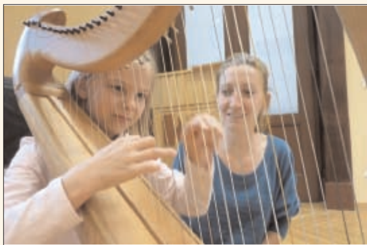
Neues Angebot: Seit Beginn dieses Schuljahres kann das Spielen auf der Harfe erlernt werden