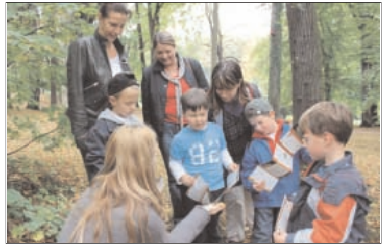
Familienexkursion in den Leinawald

Altenburg. Am Sonntag, 23. Oktober 2011, sind kleine Forscher und ihre Familien recht herzlich eingeladen, dem Ruf des Waldes zu folgen. Diesmal findet die Veranstaltung der Reihe "Naturkunde für Kinder" nicht wie gewohnt in den Räumen des Mauritianums statt, sondern führt in einer Familien-Ex-