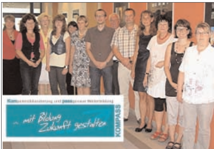
Die Mitglieder des Arbeitskreises "KOMPASS"

Mitarbeiterinnen und Mitarbeiter in den öffentlichen Verwaltungen erfüllen täglich umfangreiche staatliche und kommunale Aufgaben, die für das Land, die Region sowie für die Bürgerinnen und Bürger von hoher Bedeutung sind. Ideen, Erfahrungen, Kompetenzen und Motivation der einzelnen Mitarbeiterinnen und Mitarbeiter bestimmen dabei die Qualität der Arbeit. Die Verwaltung ist nur so gut wie die Menschen, die dort tätig sind. An dieser Stelle setzt das Projekt an. Auf Grundlage eines kompetenzbasierten Personalentwicklungskonzeptes sollen neben Fach- und Methodenkompetenzen die sozialen sowie aktivitätsbezogenen Fähigkeiten der Mitarbeiterinnen und Mitarbeiter in Führungspositionen bzw. künftigen