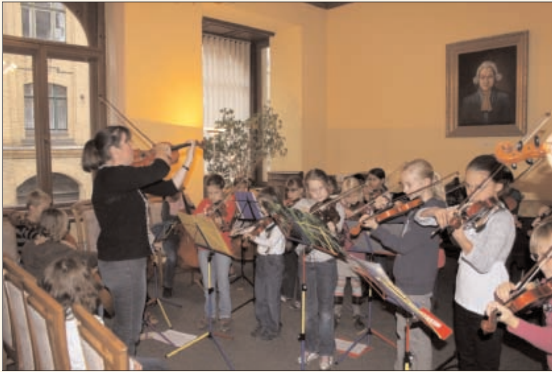
Die Streichergruppe der Musikschule bei der Probe