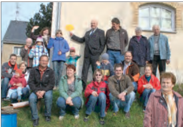
Ausgezeichnet mit dem Gütesiegel: Die Hausgemeinschaft der Dorfstraße 87 in Thonhausen