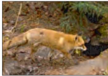
Mit steigender Fuchspopulation sinkt die Anzahl der Hasen

Der Rückgang des Niederwildes hat aber weitere Ursachen. Besonders der Lebensraumverlust durch die intensive Landnutzung ist hierfür verantwortlich. Am Ende der Veranstaltung stellte sich der Referent den interessierten Fragen des Publikums.