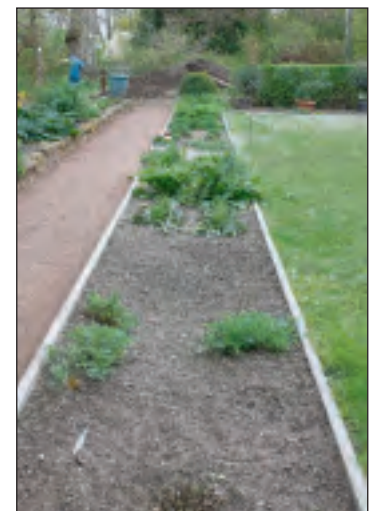
Im neu gestalteten Areal gedeihen auf ca. 40 m 2 28 verschiedene Arten von Färberpflanzen