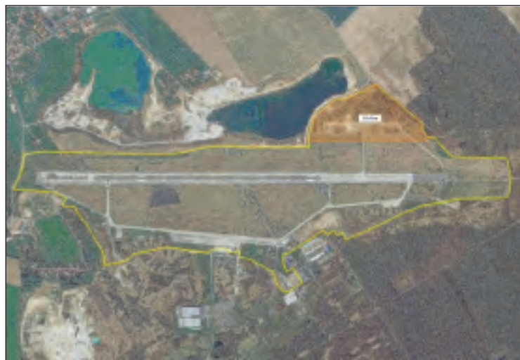
Auf einer Fläche von rund 16 Hektar (Foto links; orange markiert) entsteht auf dem Nobitzer Flugplatz einer der größten Solarparks des Altenburger Landes. Am 16. April erfolgte symbolisch der erste Spatenstich für den Bau der Anlage. Danach wurde der erste der rund 16.000 Pfosten für das Modulgerüst in den Boden gerammt (Foto rechts).