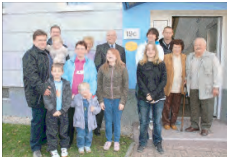
Das Gütesiegel erhielt auch die Hausgemeinschaft der Altenburger Straße 19c in Meuselwitz