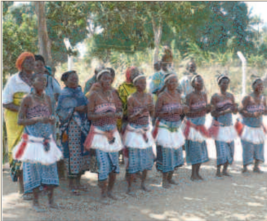
Besonders bei Reisen nach Afrika sind Impfungen angeraten

B. Blüher: Im Internationalen Reiseverkehr können von Ländern Impfungen als Einreisevoraussetzung vorgeschrieben werden. Hier steht an erster Stelle die Impfung gegen Gelbfieber bei Reisen in ein Gelbfieber-Infektionsgebiet im tropischen Afrika oder in Südamerika. Da Gelbfieber-Erkrankungen plötzlich und nicht vorhersehbar in den Infektionsgebieten auftreten können, wird die Impfung aus medizinischen Gründen bei allen Aufenthalten in Gelbfiebergebieten empfohlen; nicht nur bei Aufenthalten in Ländern, in denen eine Gelbfieber-Impfung als Voraussetzung zur Einreise vorgeschrieben ist, sondern generell in allen Ländern, in denen ein Gelbfieber-Infektionsrisiko besteht. Die amtliche Gültigkeit beginnt 10 Tage nach der Impfung und endet nach 10 Jahren. Wenn aus medizinischen Gründen eine Impfung nicht durchgeführt werden