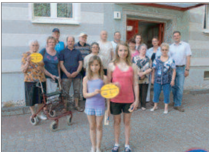
Freuen sich über das Gütesiegel: die Hausgemeinschaften im Bischofsweg (Foto oben) und die Mieter der Goethestraße 1 und 7 (unten).