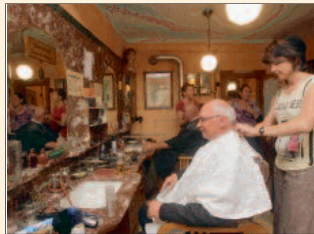
Am 9. Juni sind alle Museen in Altenburg bis nach Mitternacht geöffnet und laden wie auch in den letzten Jahren zum Bummeln und Verweilen ein.