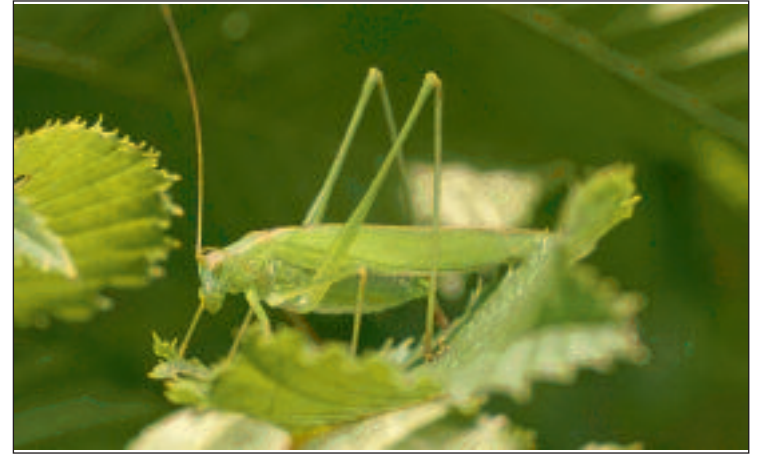
Gemeine Sichelchrecke ( Phaneroptera falcata )