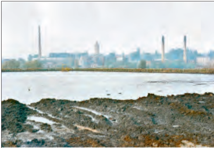
Foto oben: Blick auf das Areal des ehemaligen Teersees nach abgeschlossener Sanierung im Jahre 2012; Foto unten: Der Teersee im Jahr 1991.

In den Jahren 1916 und 1917 hatte die Deutsche Erdöl AG das Teerverarbeitungswerk in Rositz errichtet, um Kraftstoffe aus einheimischen Rohstoffen zu erzeugen. Bis 1990 wurde das Werk in der DDR als volkseigener Betrieb geführt. Auf dem Gelände wurden ca. 17 Millionen Tonnen Teer, 9 Millionen Tonnen Erdöl sowie 600.000 Tonnen weitere Rohstoffe wie Paraffine und Bitumen verarbeitet. Damit gehörte Rositz zu den größten Industriegegenden in der DDR. Doch Boden und Grundwasser wurden mit den Jahren erheblich verunreinigt, zu sorglos ging man mit Produktionsabläufen und Chemieabfällen um. Zuvor hatten bereits zahlreiche Bombardierungen im zweiten Weltkrieg dazu geführt, dass große Schadstoffmengen ins Erdreich gesickert waren. Der Teersee „Neue Sorge“ wurde deutschlandweit zu einem Begriff - zwei Hektar groß und knapp zwanzig Meter tief, wurden hier Teerabfälle verfüllt. Aus