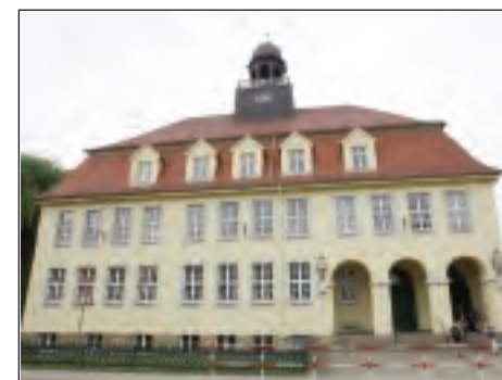
Die Meuselwitzer "Geschwister-Scholl"-Regelschule

Altenburg. Der Tag der offenen Tür der Staatlichen Regelschule & Medienschule „Geschwister Scholl“