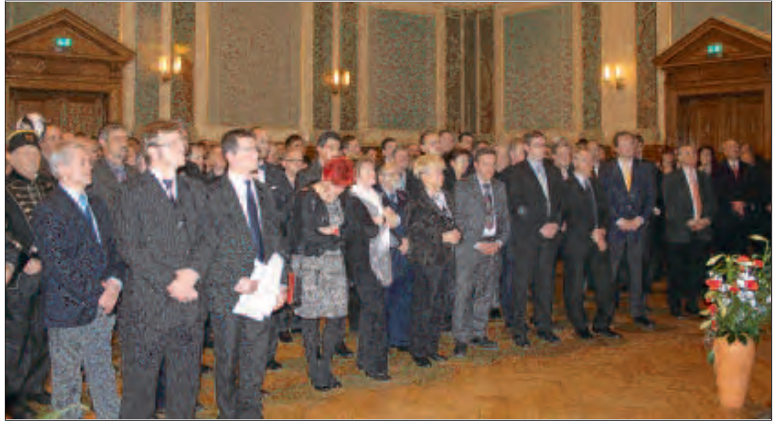
Zahlreiche Gäste verfolgten im Landschaftssaal die Neujahrsrede der Landrätin