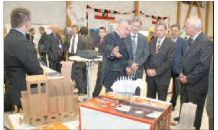
Interessante Gespräche wie hier zum Wirtschaftstag 2011 in Naunhof erwarten die Besucher und Aussteller auch in diesem Jahr in Makranstädt