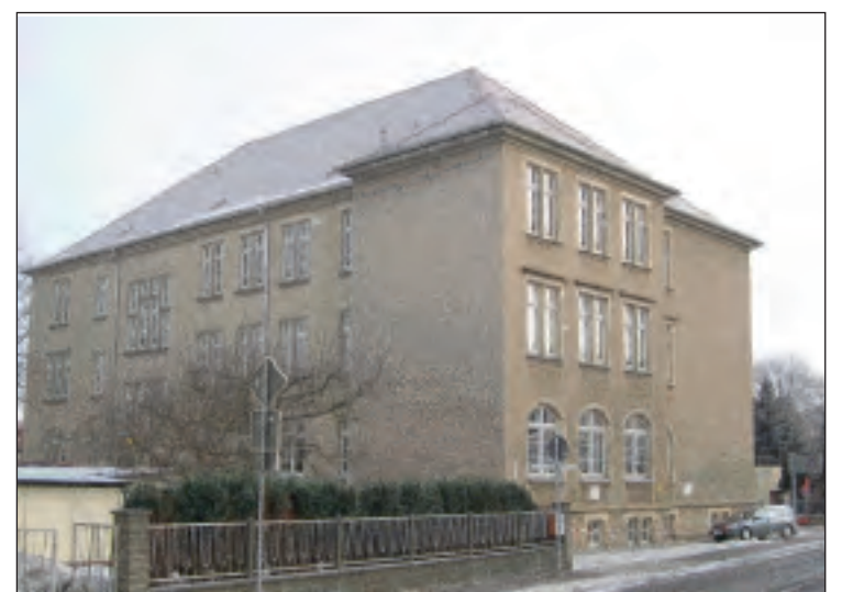
Das Meuselwitzer Gymnasium freut sich auf zahlreiche Gäste zum Tag der offenen Tür

Der Schulförderverein präsentiert sein Wirken und auch die Elternvertretung als engagierte Unterstüt-