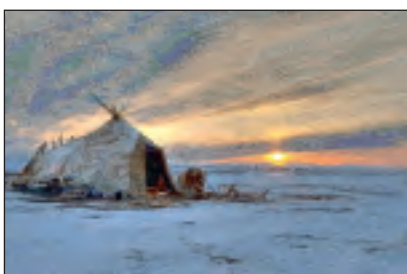
Land der Tschuktschen Text: Cordula Winter, Mauritianum

Altenburg. Zu einer 90-minütigen Multivisionsshow „Fernost - Abenteuer russische Arktis“ lädt der Jenaer Geophysiker und Bergsteiger Steffen Graupner am Mittwoch, 27. Februar 2013 um 19:00 Uhr in das Naturkundemuseum Mauritianum Altenburg ein. Auf seiner Expedition erkundete er mit Ski auf dem Eis die zugefrorene Beringstraße und per Schneemobil die weite Tundra des großen weißen Nordens und durchstreifte das