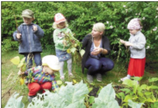
Das Ernten machte den 3-Jährigen der Kindertagesstätte „Sonnenkäfer“ in Meuselwitz besonders viel Freude