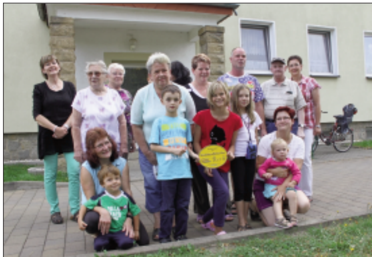
Grund zur Freude hatten die Hausgemeinschaften in Lucka (links) und Schmölln. Sie gehören jetzt zu den insgesamt vierzehn Hausgemeinschaften im Landkreis, die das Gütesiegel besitzen.