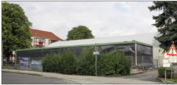
An der Turnhalle des Roman-Herzog-Gymnasiums in Schmölln werden gegenwärtig die Fassadenelemente erneuert