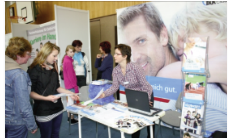
Über 55 Unternehmen und Bildungsträger präsentieren sich in diesem Jahr auf der Bildungsmesse „BERUFE AKTUELL“ in Schmölln

Altenburg. Zur 15. Bildungsmesse „BERUFE AKTUELL“ laden die Industrie- und Handelskammer Ostthüringen zu Gera, der Landkreis Altenburger Land, die Stadt Altenburg und die Agentur für Arbeit Altenburg-Gera am Sonntag, 12. Oktober 2013 in die Ostthüringenhalle Schmölln, Finkenweg 7, ein.