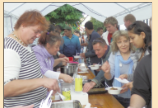
Die Premiere des Straßenfestes im vergangenen Jahr war ein voller Erfolg. Auch in diesem Jahr ist ein buntes Programm vorbereitet.