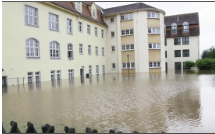
Anfang Juni wurde die Meuselwitzer Medienschule überflutet. Das Untergeschoss gleicht noch immer einer Baustelle.

Auch drei Monate nach der Flut und mit Beginn des neuen Schuljahres haben die Medienschule und das Landratsamt, Träger der Schule, mit den Folgen noch immer schwer zu kämpfen. Nach wie vor sind das Untergeschoss der Schule, in dem sich der Speisesaal sowie mehrere Arbeits- und Werkräume für den Wirtschaft-Recht-Technik-Unterricht befinden, sowie das Mehrzweckgebäude, in dem der Schulclub untergebracht ist und in das demnächst ein