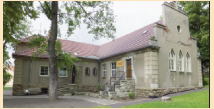
Im 1925/26 im Stil der Heimatschutzarchitektur als Vereinshaus erbauten und auch heute noch als solches genutzten Lutherhauses in Meuselwitz, wird sich der Besucher von den baulichen Veränderungen informieren können

Schmölln 10:00 - 17:00 Uhr ; Heimat- und Verschönerungsverein Schmölln e. V., Orgelbauverein-Schmölln e. V., ev. Luth. Kirchengemeinde, kath. Kirchengemeinde, Erbgemeinschaft Köhler; Markt, Rathaus , Möglichkeit der