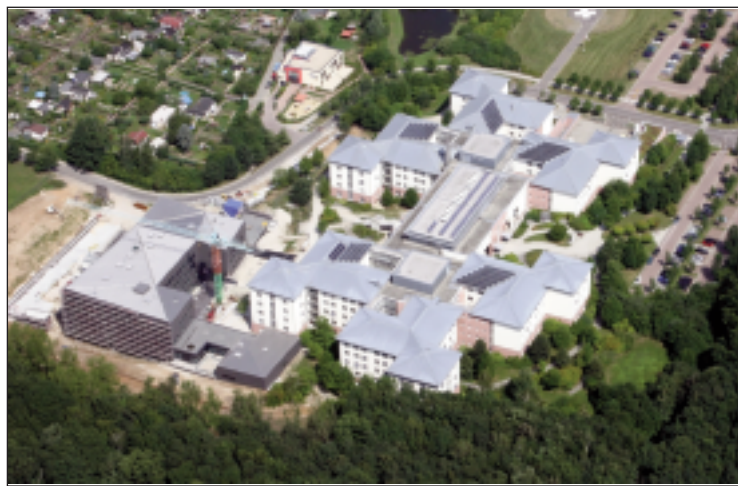
Der dunkle Klinkerbau (links) hebt sich deutlich von den anderen Gebäuden ab, ist aber fest mit dem Klinikum verbunden.