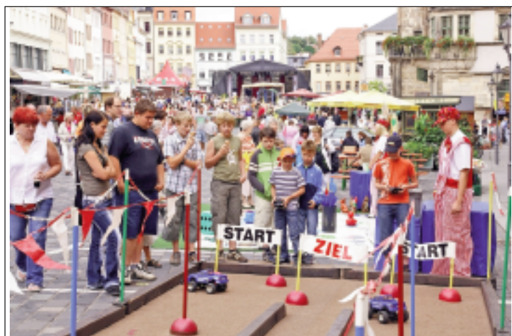
Das letzte Altstadtfest fand vor zwei Jahren statt und bot viel Unterhaltung für Groß und Klein.

ab 14:00 Uhr: Eröffnung des Altenburger Altstadtfestes und Anstich des Festbieres