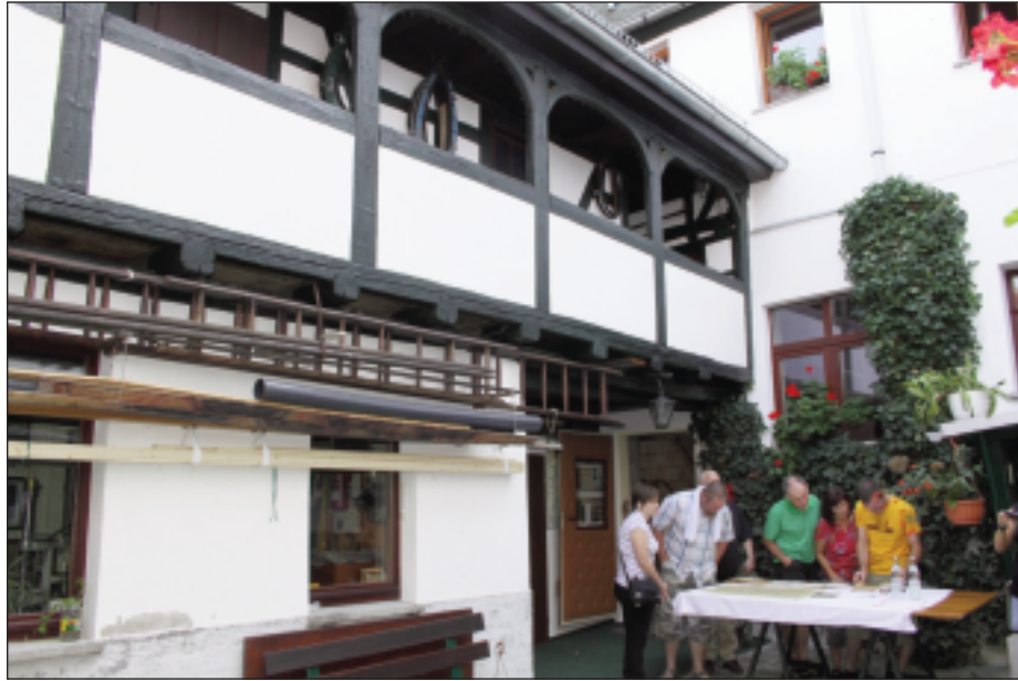
Einblicke in historische Familiendokumente werden in der Sattlerei Schiffmann in der Gößnitzer Straße 21 in Schmölln gewährt

Vor ihm steht oft die Frage nach Abbruch oder Möglichkeiten sinnvoller