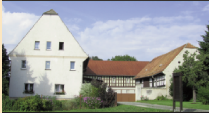
In der Mühle Schloßig wird zum Tag des offenen Denkmals erstmals die originale Mühlenausstattung zu besichtigen sein

Rositz Gemeinde Rositz, Heimatverein Rositz e. V., Ostthüringer NEUE ARBEIT e. V., Kirchengemeinde und Fiber-Trommel GmbH laden ein Öffnung der evangelische Kirche 10:00 - 12:00 Uhr, 10:00 Gottesdienst Bernsteinhof, Karl-Marx-Straße ; Besichtigung des Hofes und der alten Scheune; Einsichtnahme in die Chronik des Bernsteinhofes; geöffnete Seifenwerkstatt, Seife gießen und gestalten; Viele Aktionen für Kinder; nachmittags: hausgemachter Kuchen und Kaffee in der Bohlenstube; für weitere kulinarische Genüsse ist gesorgt Heimatscheune, Karl-Marx-Straße ; Ausstellung: „Lebensalltag zu Uromas Zeiten“ und „Zeitungen und Zeitschriften aus der DDR“ Thüringer-Fibertrommel GmbH, An der Raffinerie 6, (Außengelände) ; Zugang über Kröberne Straße 1, hinter dem Verwaltungsgebäude; 9:00 Uhr - 15:00 Uhr , Ausstellung historischer Landtechnik (Dampftraktor Marke Case Baujahr 1905, Dreschmaschine und vieles anderes mehr)