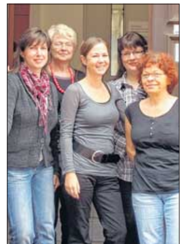
Die Mitarbeiterinnen der Beratungsstelle in der Dostojewskistraße in Altenburg

Die Beratung der Sozialpädagogisch-Psychologischen Beratungsstelle für Kinder, Jugendliche und Eltern ist freiwillig, kostenlos und steht unter Datenschutz (Schweigepflicht). Hier wird Ihnen geholfen, wenn Sie Sorgen haben. Wenden Sie sich vertrauensvoll an die Mitarbeiter. Beratungstermine erfolgen nach Vereinbarung.