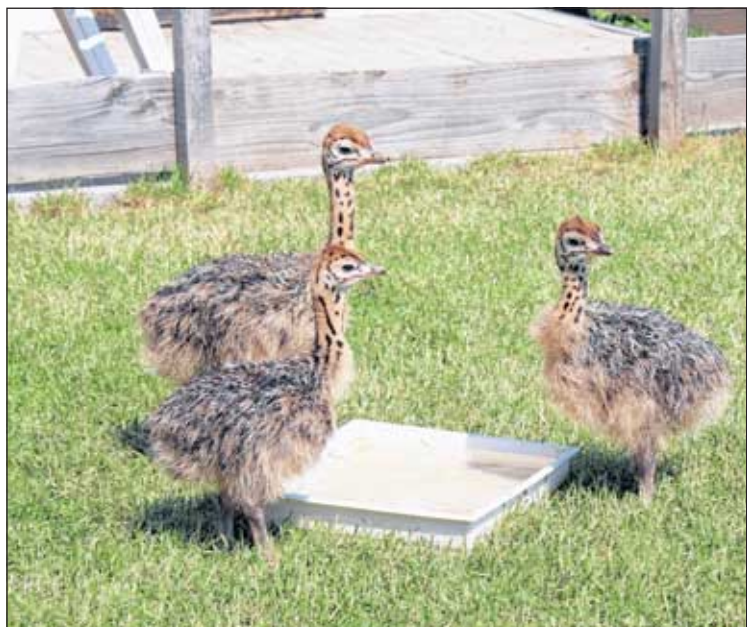
Am Wassernapf tanken die jungen Strauße neue Kraft