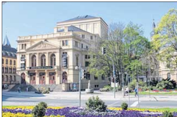
Die Zuschauer im Altenburger Theater dürfen sich wieder auf eine abwechslungsreiche Spielzeit freuen