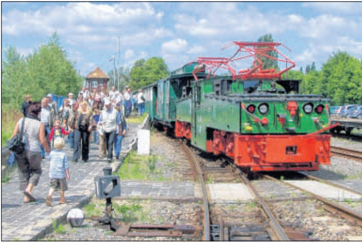
Informationen zum Fahrplan der Kohlebahn, zu Eventfahrten wie zum Beispiel den Westerntagen am 16. und 17. August sowie zum Technischen Museum im Kulturbahnhof Meuselwitz finden Sie unter www.kohlebahnen.de