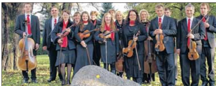
Die Mitglieder des Kammerorchesters Collegium Instrumentale e. V.

ger Runge. Im Laufe der Zeit schlossen sich dem Ensemble immer mehr Hobbymusiker an. Konzerte wurden gegeben und das Publikum dankte dies stets mit viel Applaus und Begeisterung. Derzeit blickt das Orchester auf 20 erfolgreiche musikalische Jahre zurück. Anlässlich dieses Ereignisses lädt das Kammerorchester Collegium Instrumentale e. V. am 17. Mai 2014 zu einem von zwei Jubiläumskonzerten ein. Ab 17 Uhr wird in der Stadtkirche Göbnitz Musik von J. S. Bach, M. Bruch, F. Kramar-Krommer und B. Smetana erklingen. Der Eintritt ist frei. Um freiwillige Spenden zur Deckung der Unkosten wird gebeten. Holger Runge