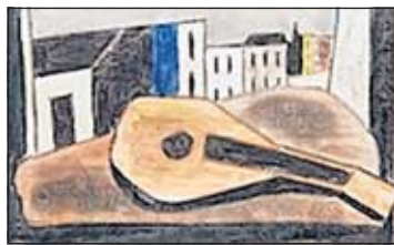
Werner Heldt, Häuser mit Laute, 1953

nen anderer Künstler – Anreger, Weggefährten, Zeitgenossen. Auch innere Verwandtschaften spielen eine Rolle. Die Ausstellungsreihe lädt dazu ein, sie in einem anderen Kontext und aus einem neuen Blickwinkel heraus zu betrachten.