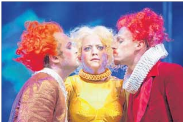
Auch wenn die warme Jahreszeit bis dahin vorbei ist: Am 9. November feiert „Ein Sommernachtstraum“ in Altenburg Premiere