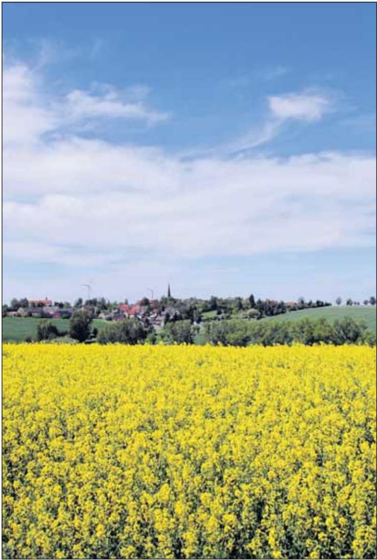
Leuchtend gelb steht der Raps im Altenburger Land derzeit in voller Blüte. Auf rund 7.000 Hektar, das sind rund 20 Prozent der gesamten landwirtschaftlichen Nutzfläche im Landkreis, bauen die Landwirte die Ölpflanze an. Schon in den nächsten Tagen wird die Ernte beginnen. Das gewonnene Rapsöl wird z. B. für die Herstellung von Biodiesel und Bioöl verwendet.

Testen Sie im Wahl-O-Mat der Bundeszentrale für politische Bildung, welche der 24 Parteien Ihre Ansichten am ehesten vertritt: Internet: www.wahl-o-mat.de