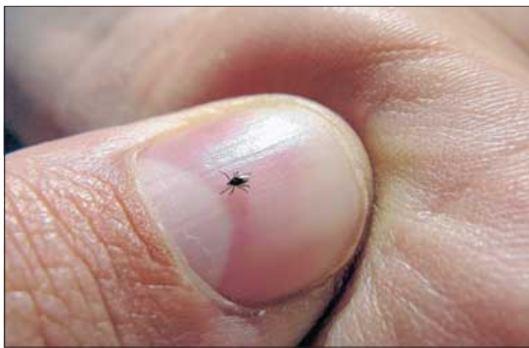
Zecken sind mit dem bloßen Auge nur schwer zu erkennen.

die Stichstelle entzünden. Sie bildet dann einen roten, scharf umrandeten Fleck, der sich nach und nach vergrößert und im Zentrum eine Aufhellung aufweist. Spätestens jetzt sollte ein Arzt aufgesucht werden, denn die