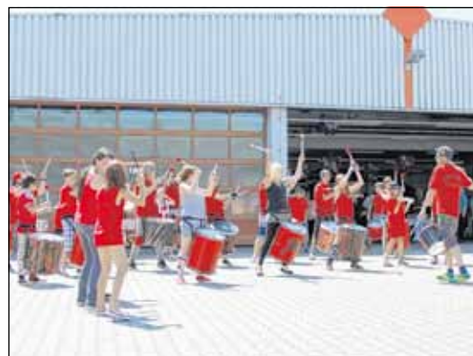
Für einen stimmungsvollen Empfang der Gäste sorgten die jungen Trommler von Como Vento. Como Vento – das ist ein soziales und integratives Projekt der Johanner-Unfall-Hilfe e. V. und des Sportvereines Aufbau Altenburg, bei dem Kinder und Jugendliche von 6 bis 27 Jahren gemeinsam trommeln. Mittlerweile sind die Trommler weit über die Kreisgrenzen hinaus bekannt und reisen zu Auftritten in ganz Deutschland.