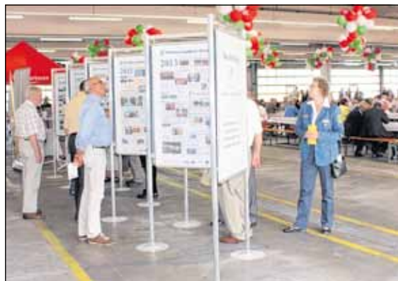
Berichte, Meldungen, Schlagzeilen und Fotos aus 20 Jahren Landkreis Altenburger Land gab es in einer kleinen Ausstellung zu sehen. Die Dokumentation stammt aus den Amtsblättern des Landkreises und wird im September noch einmal im Lichthof des Landratsamtes präsentiert, dann nämlich, wenn das Haus in der Altenburger Lindenaustraße am 14. September zum Tag des offenen Denkmals geöffnet sein wird.