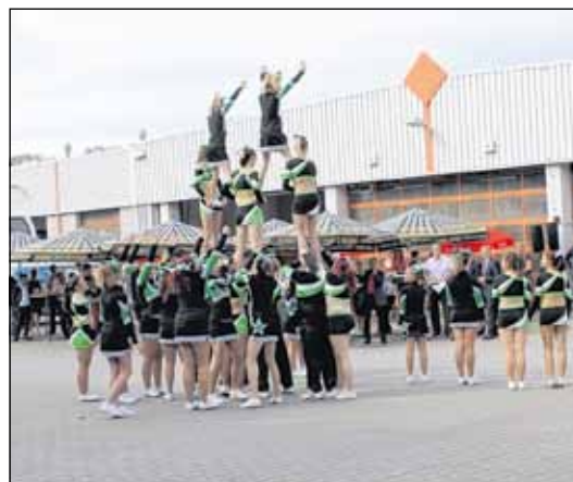
Tänzerisches, Turnerisches und Akrobatisches boten die „Flying Eagles“ aus Schmölln und erhielten von den Gästen viel Beifall. Wenige Tage vor ihrem Auftritt in Windischleuba startete die 1. Mannschaft in Magdeburg zur „Eurocheermasters“, der Europameisterschaft der Cheerleader, und wurde dort in der Kategorie „Junioren“ Vizeeuropameister.