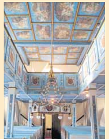
Innenansicht der Kirche in Dobraschütz nach der Restaurierung

Dazu kommt die Verantwortung der Kirchgemeinde für den Erhalt von 13 Totenkronen, eine im Altenburger Land einzigartige Kostbarkeit, die überregional Aufmerksamkeit auf sich zieht. Ein Zeugnis vom Brauchtum der Al-