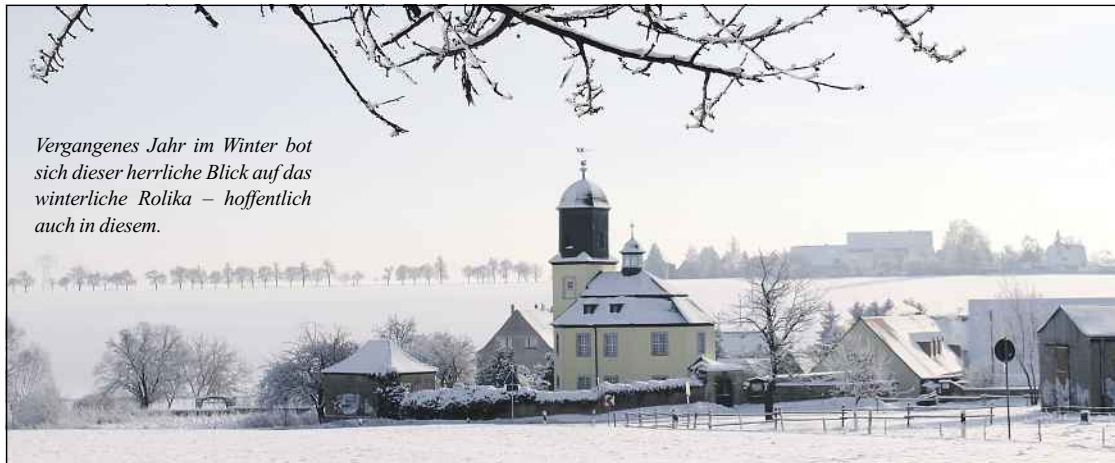
Vergangenes Jahr im Winter bot sich dieser herrliche Blick auf das winterliche Rolika – hoffentlich auch in diesem.