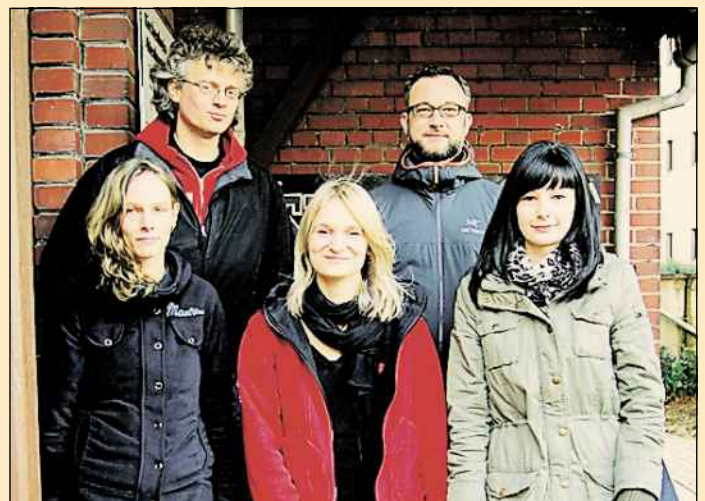
Das Team der Aufsuchenden Jugendsozialarbeit im Altenburger Land des Ev.-Luth. Magdalenenstiftes

Hilfesuchende können sich darüber hinaus an die Fachkräfte in ihrer Nähe, in den Freizeiteinrichtungen, der Jugendarbeit und Jugendsozialarbeit, der Schulsozialarbeit, an ihre LehrerInnen und natürlich auch an ihre niedergelassenen Ärzte wenden.