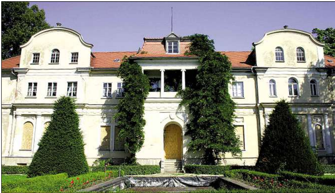
Das Schlösschen ist das Schmuckstück des riesigen Tannenfeld-Areals

Altenburg. Für die in der Gemeinde Löbichau gelegene Schloss- und Parkanlage Tannenfeld, deren Eigentümer der Landkreis Altenburger Land ist, gibt es neue Hoffnung auf baldige Sanierung. Seit 2004 steht das Anwesen mit kurzen Unterbrechungen leer und wird auch künftig für kreisliche Zwecke nicht mehr benötigt.