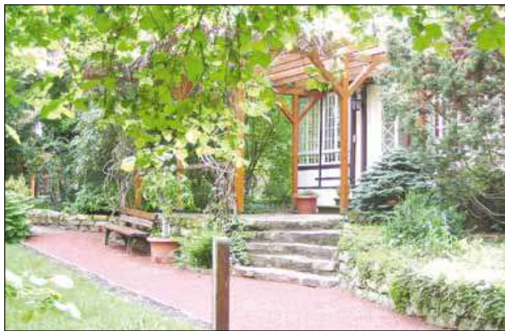
Der Gartenpavillon ist eine Oase der Entspannung

nalgetreu erhalten gebliebenem Wegenetz durchzogen wird, rund 2.500 verschiedene Pflanzenarten weltweiter Herkunft bewundert werden. Neben vielen farbenprächtigen blühenden Gewächsen wie Rhododendron, Hortensien, Pfingstrosen, Frühblühern und Sommerblumen sind auch solche dabei, die normalerweise fernab unserer Region beheimatet sind: Ginkgobäume, die in Asien gedeihen, Mammutbäume und eine Hemlocktanne, wie sie hauptsächlich in Nordamerika zu finden sind, ein seltener Blauglockenbaum, der ursprünglich aus China kommt. Hinzu kommt eine Sammlung von rund 900 teils seltenen Kakteen. Vom Gartenpavillon aus – denkmalgeschützt wie die gesamte Anlage – hat man einen wunderbaren Blick auf den kleinen romantischen, mit blühenden Seerosen überzogenen Goldfischteich und weite Teile des Pflanzenareals. Jeden Samstag und Sonntag (an anderen Tagen nach Vorabsprache) gibt es hier von 14 bis 17 Uhr auch Kaffee und Kuchen.