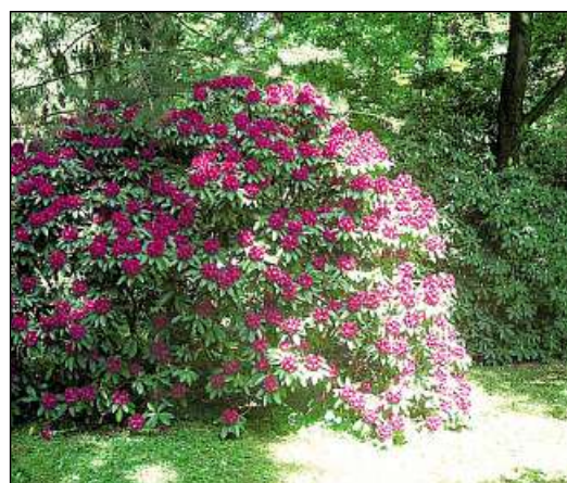
Wunderschön blüht der Rhododendron im Frühsommer