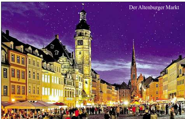
Der Altenburger Markt

Altenburg. Neben den über 50 Händlern, die ihre Türen zur Frühlingsnacht am 27. März in Altenburg öffnen, erwartet die Besucher ein abwechslungsreiches Rahmenprogramm. Die Stadt Altenburg und die Theater & Philharmonie Thüringen behaupten, dass es anlässlich des 850-jährigen Jubiläums des 1. Aufenthaltes Barbarossas in Altenburg gelingt, einen großen „Barbarossa-Chor“ zu initiieren. Es sind so viele AltenBÜRGER und Gäste wie möglich aufgerufen, zehn Strophen des Kneipenliedes „Kommt her, kommt her“ aus der Produktion der Rockerette „Barbarossa ausgeKYFFt“, die im Mai 2015 im Landestheater Premiere haben wird, gemeinsam zu singen. Die einzelnen Lied-