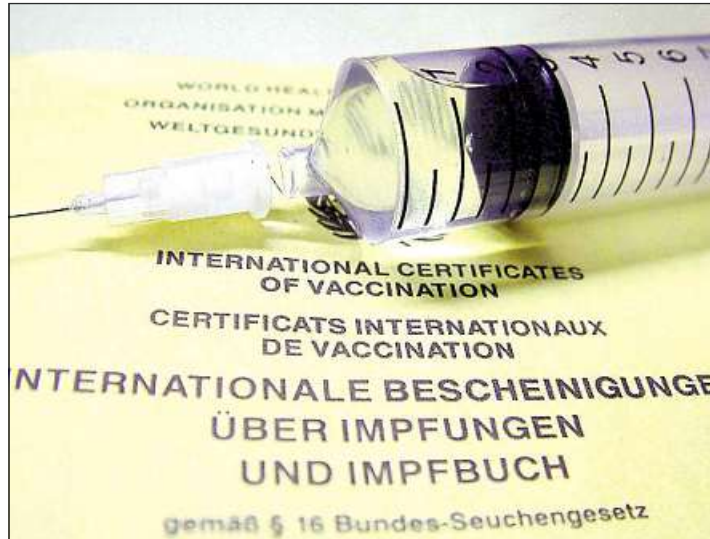
Impfen schützt vor der Masernerkrankung

Da es bei einer Masernvirusinfektion zu einer vorübergehenden Immunschwäche von etwa sechs Wochen Dauer kommt, sind bakteriellen Zusatzinfektionen möglich, wie Mittelohrentzündungen, Entzündungen