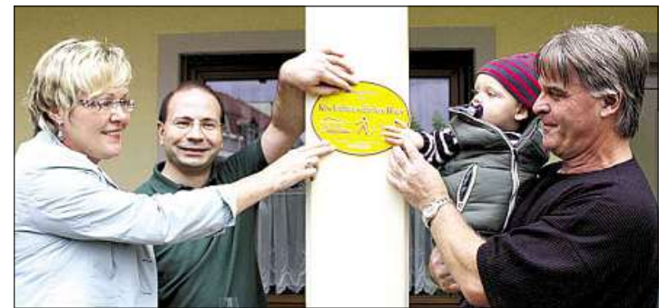
Im vergangenen Jahr freuten sich u. a. die Mieter des Brückenplatzes 24-30 in Schmölln über das Gütesiegel

Altenburg. Vor drei Jahren startete der Landkreis die Aktion „Kinderfreundliches Haus“. Bisher konnten schon Gütesiegel an 18 Hausgemeinschaften im Altenburger Land vergeben werden. Jetzt findet der beliebte Wettbewerb seine Fortsetzung.