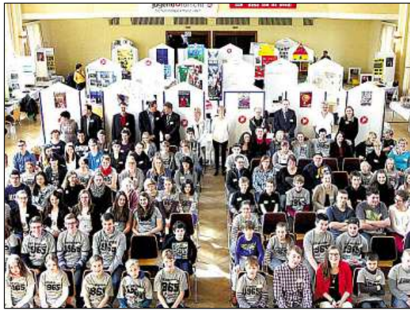
Zum „Jugend forscht“-Regionalwettbewerb kamen 83 Schülerinnen und Schüler ins Kulturhaus nach Rositz. 13 Projekte werden Ende März beim Landesfinale in Jena präsentiert.