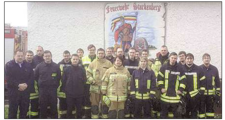
Lehrgangsteilnehmer und Lehrer vor der Feuerwehr in Starckenberg

Altenburg. Zuletzt schlossen 13 junge Feuerwehrleute ihre Truppführer-Ausbildung ab. Die engagierten Kameraden absolvierten über einen Monat insgesamt 35 Ausbildungsstunden in Starckenberg.