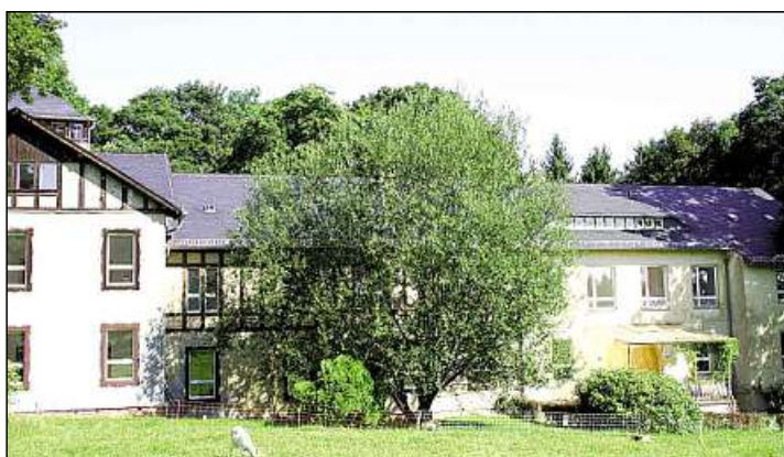
Das Haus Tanegg-Waldegg diente vorübergehend als Seniorenheim