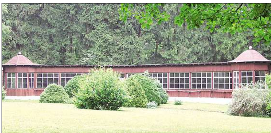
Idyllisches Arrangement: Die Liegehalle vor Waldkulisse und inmitten der Parkanlage