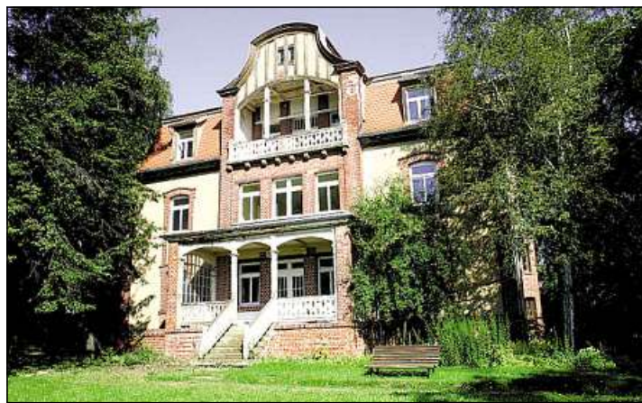
Auch das Haus Planegg ist ein wahrer Blickfang

baute Parkanlage sitzt schon in den Startlöchern und hat eine entsprechende Nutzungsvorvereinbarung bereits im Februar unterschrieben: Die PML Pflege mit Leidenschaft GmbH Erfurt will ab 2017 eine ambulante Spezial-Altenpflege in Tannenfeld anbieten – für etwa 80 an Demenz erkrankte Senioren. Um die ganzheitli-