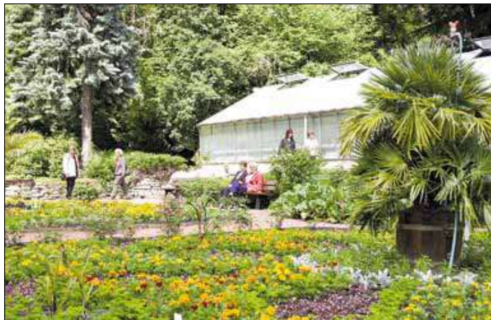
2.500 verschiedene Pflanzenarten wachsen im Garten

Derzeit können auf dem 8.500 Quadratmeter großen Gelände des Botanischen Erlebnisgartens, das von einem 1.000 Meter langen, origi-