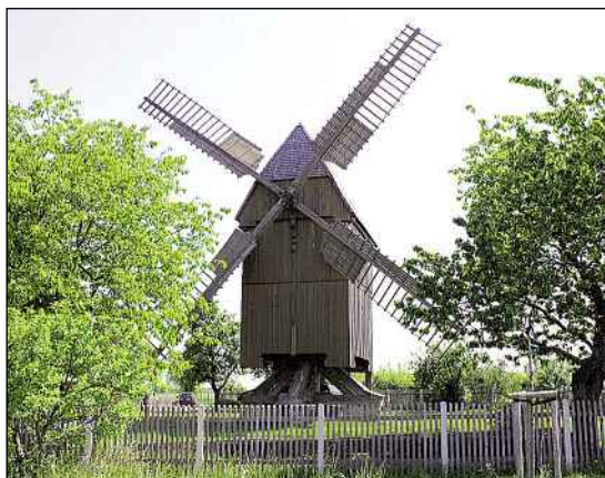
Die Bockwindmühle in Lumpzig ist ein Symbol des ländlichen Lebens im Altenburger Land