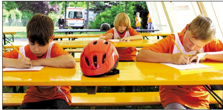
Auch die Theorie will gelernt sein