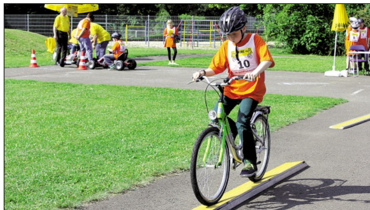
Beim Parcours waren fahrerisches Geschick, Konzentration und ein guter Gleichgewichtssinn gefragt