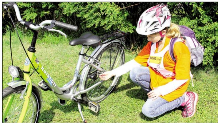
Nur wenn das Rad auch technisch ohne Fehl und Tadel ist, darf losgeradelt werden – auch dies war Inhalt der Ausbildung