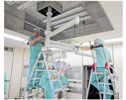
Hatten eine Woche im Klinikum zu tun, die Mitarbeiter der Fa. Trumpf.

Farbspektrum eingestellt und jederzeit gewechselt werden. Auch mit Handschuhen ist der Operateur in der Lage, nur durch Berührung, die Einstellungen der Leuchten zu verändern. Die Leuchten rotieren auf mehreren Achsen jeweils um 360 Grad, sodass jede Situation individuell optimal ausgeleuchtet werden kann. Damit wurden für die Operateure optimale Lichtverhältnisse zum Operieren geschaffen.