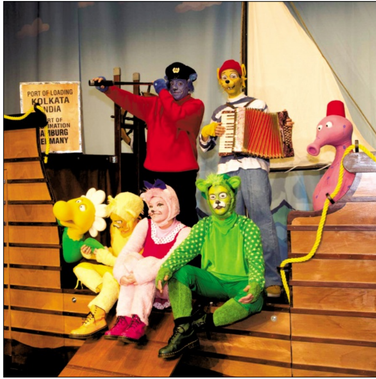
Käpt'n Blaubär (oben links) ist eine Figur, die einst von Walter Moers erdacht wurde und durch die Puppentrickserie „Käpt'n Blaubärs Seemannsgarn“ in der „Sendung mit der Maus“ bundesweit bekannt wurde

Spannend, unterhaltsam und voller Witz lässt das Kindermusical die großen und kleinen Zuschauer die unglaublichen Abenteuer von Käpt'n Blaubär miterleben. Als Musical live auf der Bühne entfaltet die TV-Puppentrickserie noch einmal einen ganz besonderen Zauber. Die tollen Geschichten und die liebevolle Umsetzung verwandeln die Spielfläche in eine einzigartige Theaterwunderkammer der Phantasie. Und dank der spielfreudigen Darsteller, der kreativen Bühnenbilder und Kostüme und natürlich der eingängigen Musik taucht das Publikum mitten in die Welt von sagenhaften Meeresbewohnern, von Flauten und Stürmen ein. Gemeinsam mit der WDR media-group GmbH hat die Cocomico