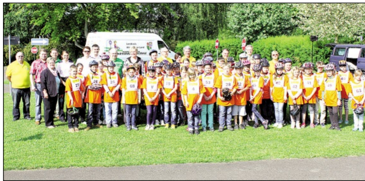
Bei strahlendem Sonnenschein strahlt Jung und Alt um die Wette