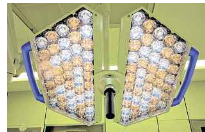
Ein Blick in die Multilinsenmatrix.