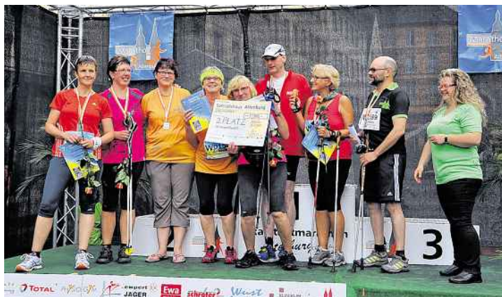
Riesige Freude über den hart erkämpften 2. Platz.