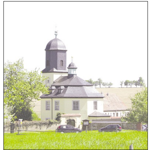
Auch von außen ist die schöne Romschützer Kirche ein wahrer Blickfang

Altenburg. Der Kreistag des Landkreises Altenburger Land hat auf seiner Sitzung am 2. September 2015 den Verkauf der Schloss- und Parkanlage Tannenfeld beschlossen und die Landrätin ermächtigt, den entsprechenden Kaufvertrag zu unterzeichnen. Mit ihrer Entscheidung machten die Mitglieder des Kreistages den Weg frei für eine Investorengruppe, die das Anwesen sanieren und danach an einen Betreiber zur Spezialpflege für an Demenz erkrankte Senioren vermieten sowie einen Handwerkerhof etablieren will.