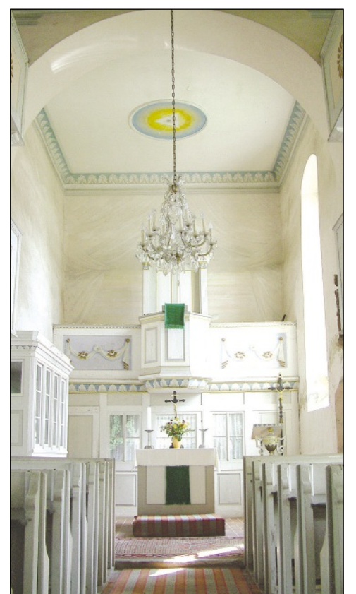
Innenraum der Kirche in Heyersdorf