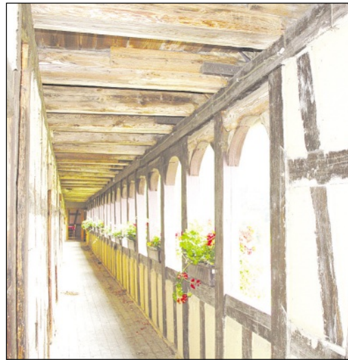
Der Laubengang auf dem Rittergut Schwanditz ist mit seinen 23 Bögen der längste Thüringens