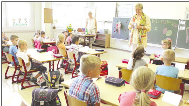
Landrätin Michaela Sojka wünscht den Erstklässlern der Grundschule in Schmölln einen guten Start

Um die Lernbedingungen an den Schulen weiter zu verbessern, nutzte der Landkreis die sechswöchigen Sommerferien, um in verschiedenen Schulen dringend erforderliche Sa-