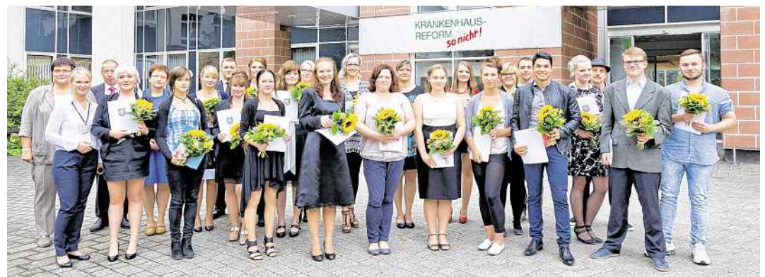
Absolventinnen und Absolventen der Krankenpflegeschule.

In feierlichem Rahmen bekamen stolze Gesundheits- und Krankenpfleger nach 3-jähriger Ausbildung ihre Zeugnisse im Hörsaal des Klinikums überreicht. Gemeinsam mit den Gesundheits- und Krankenpflegehelfern, die ihre 1-jährige Ausbildung beendeten, freuten sich alle Schüler gemeinsam mit ihren Lehrern und Ausbildern über ihr erreichtes Ziel. Mit ihren Ausbildungen sind sie sehr gefragt, nicht nur auf dem hiesigen Arbeitsmarkt. Neun der