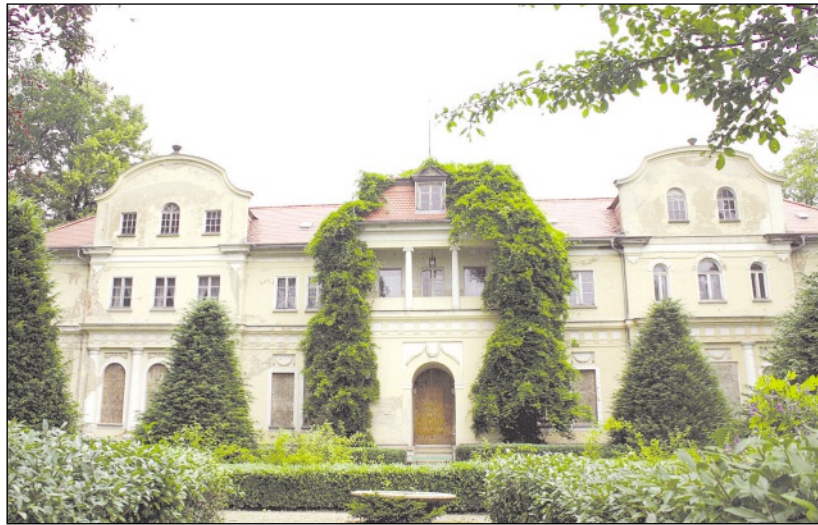
Die spätbarocke Schlossanlage Tannenfeld entstand um 1800 und wurde für die damalige Herzogin Dorothea von Kurland gebaut