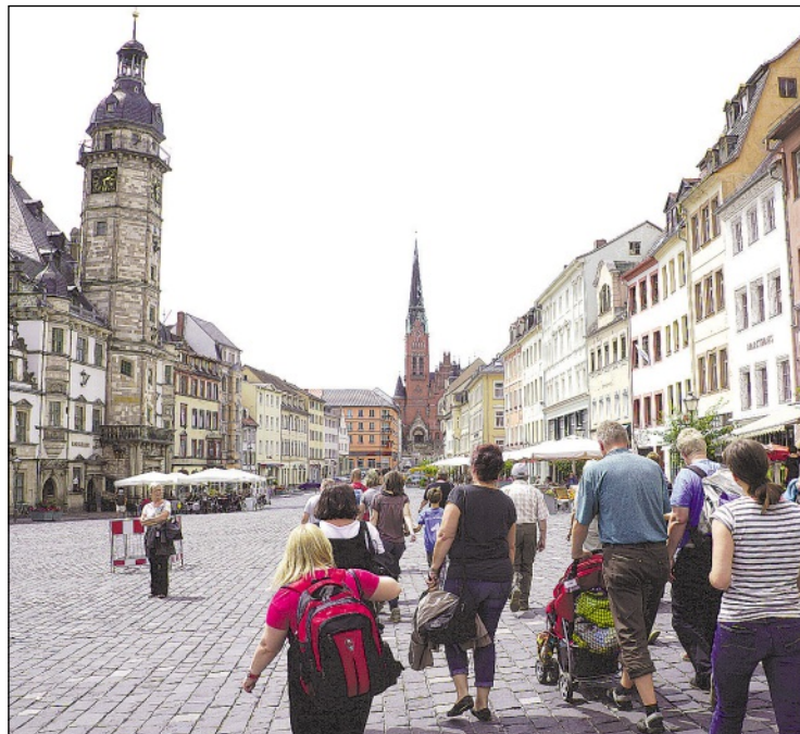
In Altenburg gibt es viel zu entdecken

Bis zum 18. September 2015 können sich Einrichtungen mit jeweils einem Team, bestehend aus ca. zehn 10-jährigen Kindern, bewerben unter info@schnittstelle-leipzig.de oder 0341 58090609. Die Teilnahme inklusive Lunchpaket ist kostenlos, lediglich die Anfahrt mit dem ÖPNV erfolgt auf eigene Kosten. Jedes Team erhält im Vorfeld eine individuelle Anfahrts- und Ticketempfehlung.