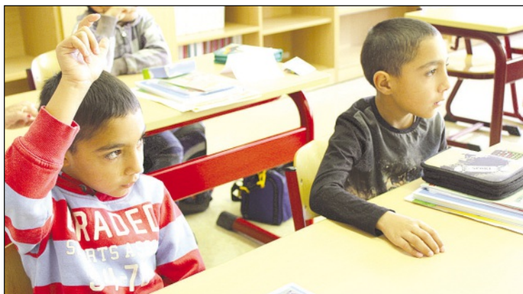
Gleich am ersten Schultag sind die Kinder eifrig dabei, sind wissbegierig und haben Spaß am Unterricht

nierungsarbeiten zu realisieren. In 14 Schulgebäuden fanden mehr oder weniger aufwendige Bauarbeiten statt. „Natürlich ist der Investitionsstau in unseren Schulen noch immer groß. Den werden wir nur langsam, Schritt für Schritt, abbauen können,