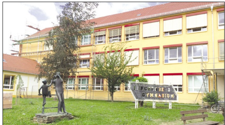
Die Außenfassade des Lerchenberggymnasiums hat einen mediterranen Farbanstrich erhalten

Landkreis. Nachdem während der Sommerferien mehr als eine Million Euro an Schulen des Landkreises verbaut wurde (u. a. Lerchenberggymnasium, Foto), fließen nun noch einmal über 200.000 Euro in Sanierungsarbeiten an Bildungseinrichtungen im Altenburger Land.