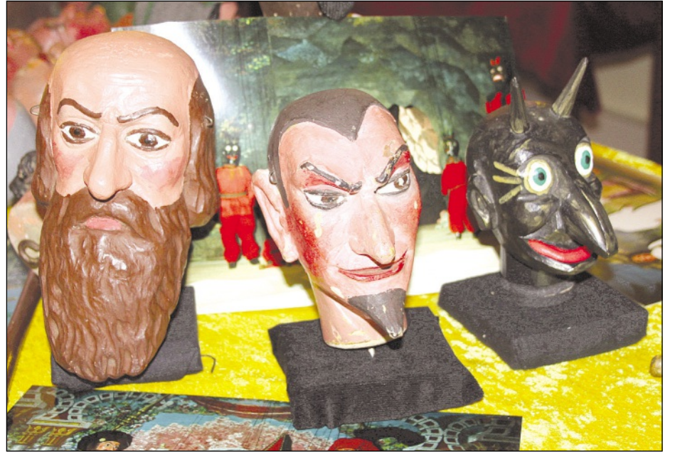
Diese Holzmarionettenköpfe sind im „Hinteruhmannsdorfer Komödiantenhof“ zu sehen

Altenburg, Poststraße und Meuselwitz, Nordstraße 10 Uhr und 14 Uhr Altenburger Geschichtsverein e. V.