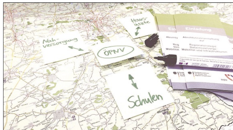
Gut anderthalb Jahre dauerte das Forschungsprojekt

Landkreis. Im Landratsamt des Altenburger Landes wurden am 3. September 2015 die Ergebnisse des durch das Bundesministerium für Verkehr und digitale Infrastruktur (BMVI) finanzierten Forschungsprojektes „Regionalstrategie Daseinsvorsorge: Mobilität und Infrastrukturen“ vorgestellt. Die präsentierten Analysen und Handlungsmöglichkeiten sollen helfen, die Herausforderungen des demografischen Wandels zu bewältigen. Im Zentrum der „Regionalstrategie Daseinsvorsorge“ stehen die hausärztliche Versorgung, der Lebensmittelhandel sowie Schulen in Verbindung mit der Erreichbarkeit durch den öffentlichen Personennahverkehr (ÖPNV). Zunächst wurde die Entwicklung dieser Daseinsvorsorgebereiche bis zum Jahr 2030 prognostiziert sowie Defizi-