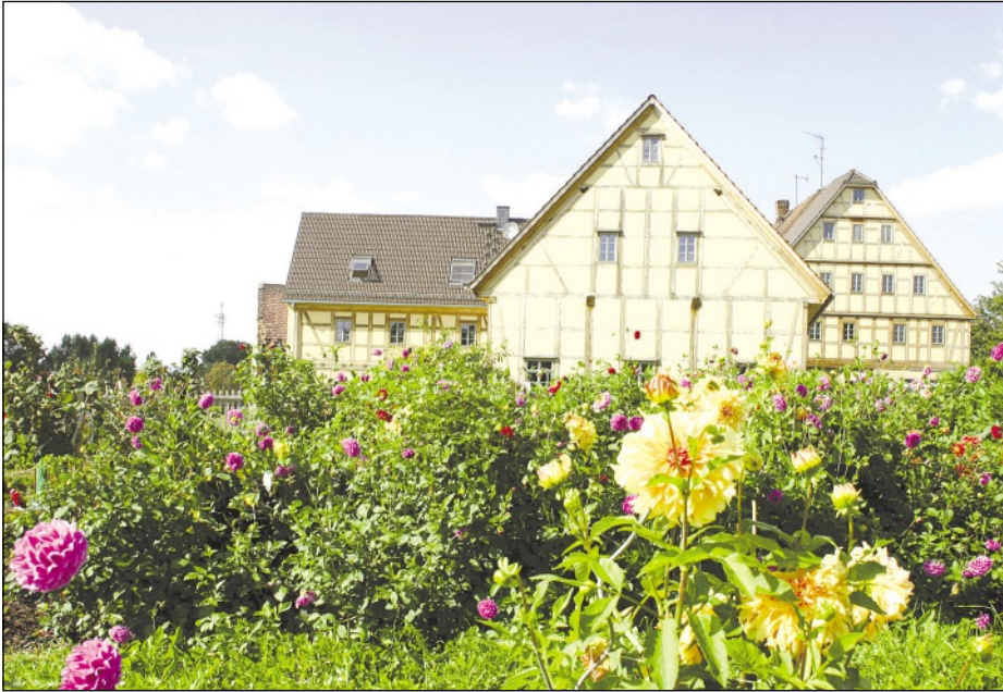
Blühende Pflanzen vor dem Quellenhof in Garbisdorf