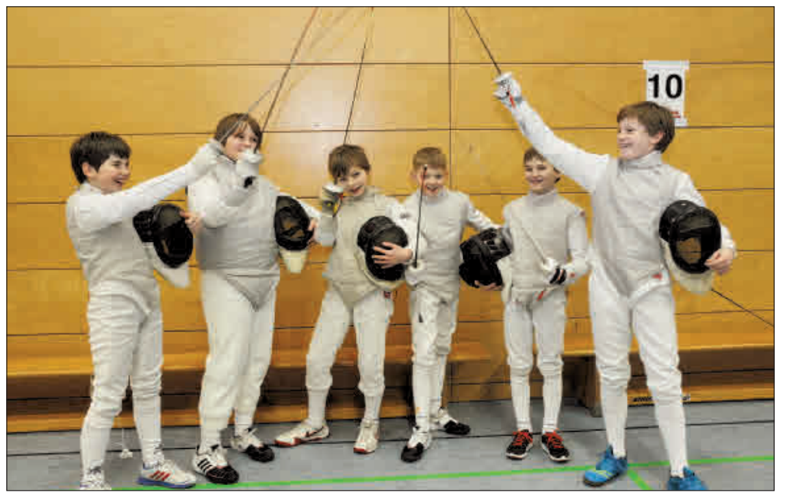
Die jungen Fechter vom SV Einheit Altenburg sorgen bei vielen Turnieren für Aufsehen und repräsentieren den Landkreis sehr erfolgreich.