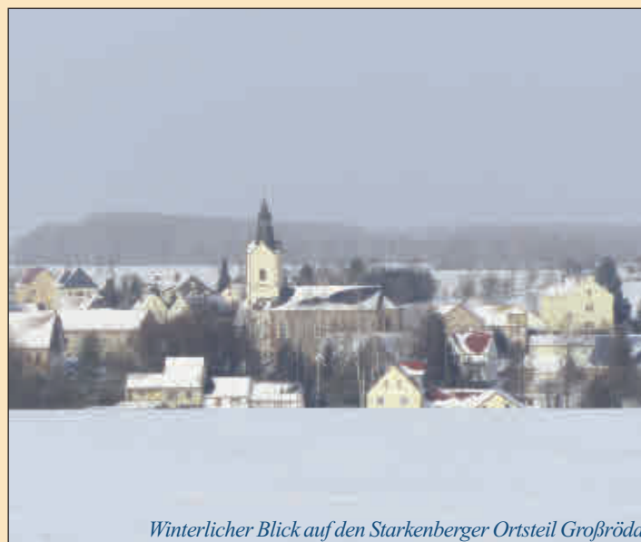
Winterlicher Blick auf den Starkenberger Ortsteil Großbröda