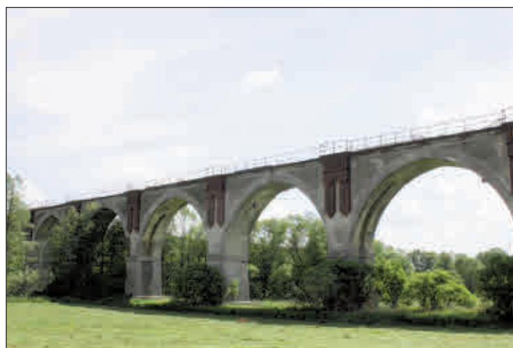
Fahren hier schon bald Radfahrer? Das Viadukt im Wieratal bei Frohnsdorf