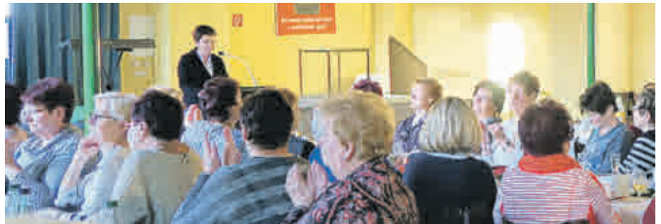
Gemütliches Beisammensein beim alljährlichen Treffen in vorweihnachtlicher Atmosphäre

Beim Abschied hieß es dann: Alle Jahre wieder... – also dann, bis zum nächsten Mal.