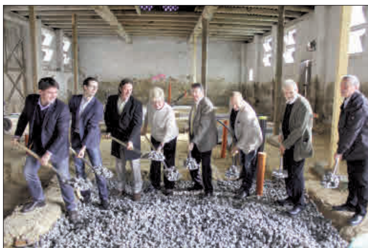
Spatenstich in der Sonnenscheune Plottendorf