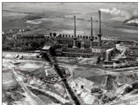
Die Brikettfabrik „Phönix“ in Mumsdorf war von 1912 bis zum Jahre 2000 in Betrieb.