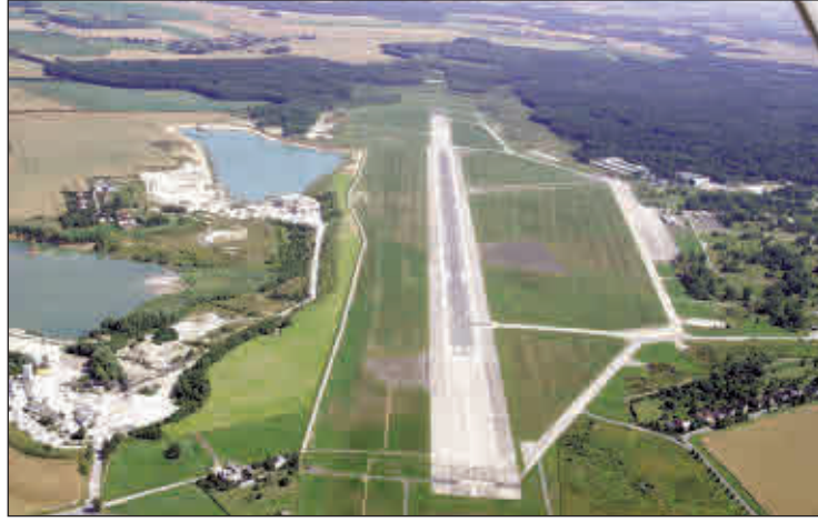
Luftbild vom Leipzig-Altenburg-Airport in Nobitz

mittels Instrumenten bei insbesondere schwierigen Wetterlagen stattfinden kann. Um einen solchen gefahrlosen Anflug gewährleisten zu können und zusätzliche Gefahren durch Hindernisse in den Anflugrichtungen auszuschließen, wurde wie bei allen anderen Flughäfen ein Bauschutzbereich durch die Thüringer Landesluftfahrtbehörde festgesetzt. Dieser Bauschutzbereich bedeutet u. a., dass innerhalb seines Geltungsbereiches die Errichtung von Gebäuden, Anpflanzung von Bäumen, wenn diese in der Höhe ein Hindernis darstellen können, einer Genehmigung durch die Landesluftfahrtbehörde bedürfen. Die Landesluftfahrtbehörde überwacht insoweit auch regelmäßig die Einhaltung der geltenden Höhenbeschränkungen im Bauschutzbereich. Jeder Eigentümer in der Nähe eines Flugplatzes ist in-