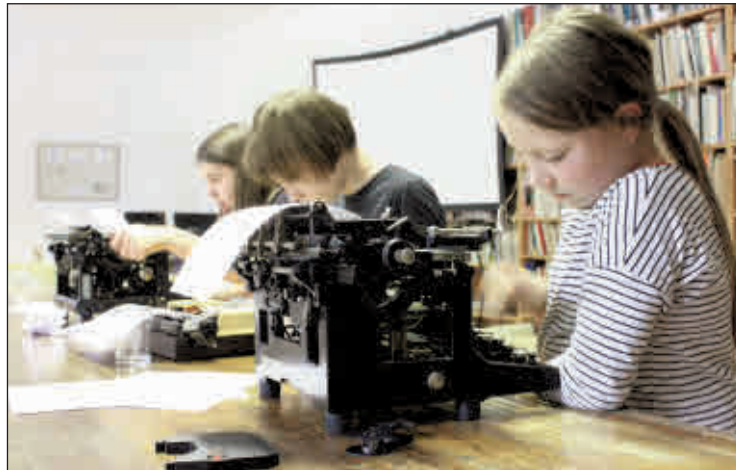
Das Studio Bildende Kunst im Lindenau-Museum bietet auch in diesem Jahr spezielle Ferienkurse für Kinder an.

◆ 19:11 Uhr, Lucka: Karnevalsveranstaltung des Karnevalsclub „Birke“ e.V., Gaststätte „Zur Birke“, Ziegeleiweg 13 ◆ 19:11 Uhr, Lucka: