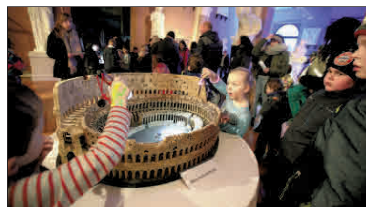
Besucher der erfolgreichen ersten Kindermuseumsnacht 2018 durchleuchten begeistert das Korkmodell vom Kolosseum.