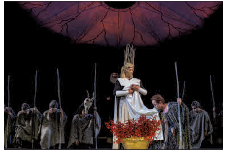
Szenenbild aus der Oper „Œdipe“ in der Inszenierung von Theater & Philharmonie Thüringen.

Altenburg/Gera. In der Spielzeit 2017/18 brachte Theater & Philharmonie Thüringen unter begeistertem Zuspruch von Publikum und Fachpresse die Oper „Œdipe“ des rumänischen Komponisten George Enescu auf die große Bühne im Theater Gera. Hier folgen nun zwei weitere Aufführungen am 10. Februar und letztmalig am 17. Februar jeweils um 14.30 Uhr. Zur Premiere im Großen Haus des Altenburger Landestheaters kommt die Inszenierung dann am Sonntag, 24. Februar 2019 um 18 Uhr. Dort folgen weitere Vorstellungen am 1. März um 19.30 Uhr sowie am 28. März um 14.30 Uhr.