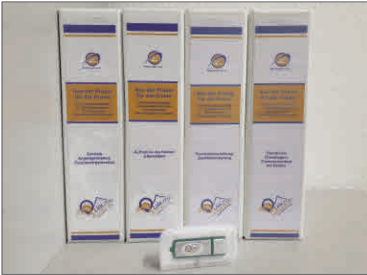
Vier dicke Ordner umfasst das Material „Aus der Praxis für die Praxis“, das Kindertagesstätten Hilfestellungen bei der Qualitätssicherung gibt.

Altenburg. Im feierlichen Rahmen trafen sich vor wenigen Tagen Führungskräfte und Pädagogen aus 37 kommunalen Kindertagesstätten, Trägervertreter aus den Kommunen, Mitarbeiter der Deutschen Kinder- und Jugendstiftung (DKJS) sowie die zuständige Fachkraft für Kita-Aufsicht des Thüringer Ministeriums für Bildung, Jugend und Sport mit Landrat Uwe Melzer und der Kita-Fachberatung des Landratsamtes Altenburger Land. Anlass dieser Zusammenkunft war die Übergabe zweier Ordner „Aus der Praxis für die Praxis“ an alle kommunalen Kindertagesstätten und deren Träger.