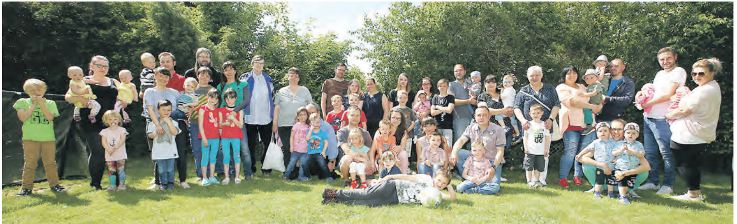
Bei herrlichem Frühlingswetter hatten die Kinder den Spielparcour im Garten schnell erobert, ließen sich aber von ihren Eltern gern zu einem gemeinsamen Foto überreden.