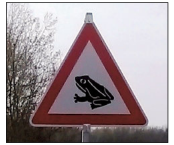
Verkehrszeichen als Hinweis an Autofahrer, Rücksicht auf Amphibienwanderung zu nehmen.

Überqueren der Straße überfahren werden. Durch die Betreuer der Schutzzäune werden die Eimer morgens und abends kontrolliert und die vorgefundenen Kröten, Frösche und Molche vorsichtig entnommen und zum Laichgewässer transportiert. Dabei werden die Anzahl und die verschiedenen Arten der Tiere in Sammelprotokollen notiert. Außerdem werden täglich Angaben zu Temperatur und Wetter gemacht, um später die Sammelergebnisse auswerten zu können. So wurden die Wanderungen seit vielen Jahren verfolgt und es waren teilweise erstaunliche Zahlen zu verzeichnen. In den Jahren 1999 und 2000 wurden bisher die zahlreichsten Ergebnisse registriert. Die Anzahl der „geretteten“ Kröten und Frösche lag in diesen Jahren bei einzelnen Strecken zwischen 2.000 und 5.800 Tieren. In besonders warmen Nächten haben die Sammler manchmal 400 bis 500 Tiere zu transportieren, zu zählen und zu bestimmen – das ist