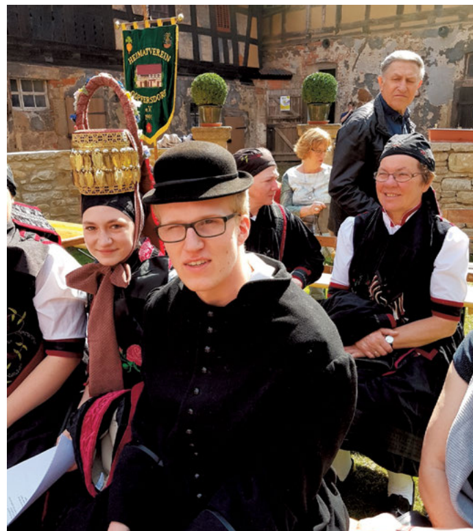
Begegnung und Austausch beim Kreisheimatfest 2018.