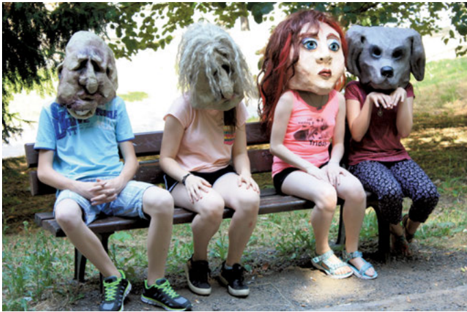
Ergebnisse aus dem letzten Workshop „Vollmasken“.

Kursleitung: Susann Schade; dienstags, wöchentlich 15-16 Uhr; 56 €/Hj.