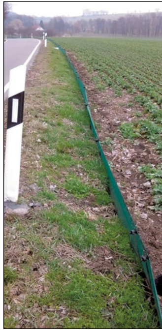
An einigen Straßenabschnitten im Landkreis stehen Amphibienschutzzäune, die den wandernden Tieren ein gefahrloses Unterqueren der Straße ermöglichen sollen.

Die am Straßenrand fest installierten Kunststoff-Leitwände und die Durchlässe unter den Straßen werden vor Beginn der Amphibienwanderung von Laub und Schmutz gereinigt, um den wandernden Tieren die Benutzung zu erleichtern. Ebenso ist nach dem Winter an diesen Schutzanlagen zu kontrollieren, ob Teile der Leitwände beschädigt sind und ihre Funktion nicht mehr erfüllen können. Das kann immer wieder passieren, sei es durch Verkehrsunfälle oder durch Räumfahrzeuge des Winterdienstes, durch herabstürzende Äste, aber auch durch absichtliche Zerstörung. Diese Schäden müssen vor der Frühjahrswanderung re-