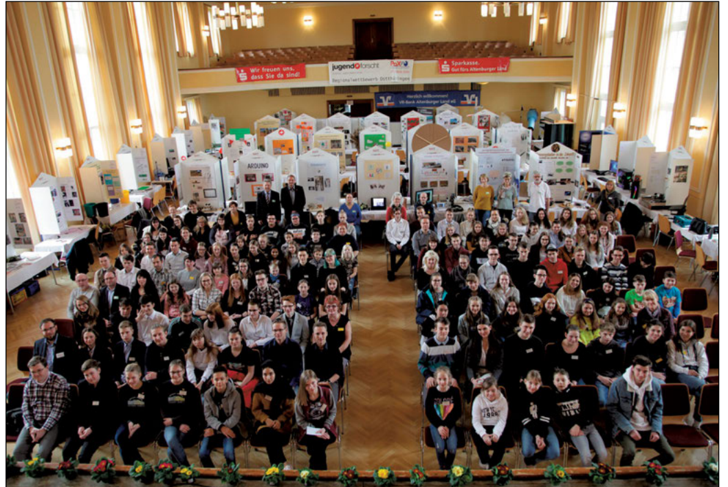
Unter dem Motto „Schaffst Du!“ fand am 27. und 28. Februar im Kulturhaus Rositz die 26. Ostthüringer Regionalmesse „Jugend forscht – Schüler experimentieren“ statt.