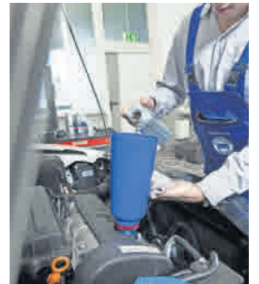
Das Motoröl ist das Lebenselixier des Automobils.

Von einem Do-it-yourself-Ölwechsel sei abzuraten, sagt ein Sprecher des Zentralverband Deutsches Kfz-Gewerbes (ZDK). Er erfordere nicht nur technisches Know-how und Geschick. Fehler könnten zu Motorschäden führen, oder Öl dringe unkontrolliert ins Erdreich und könne so der Umwelt schaden.