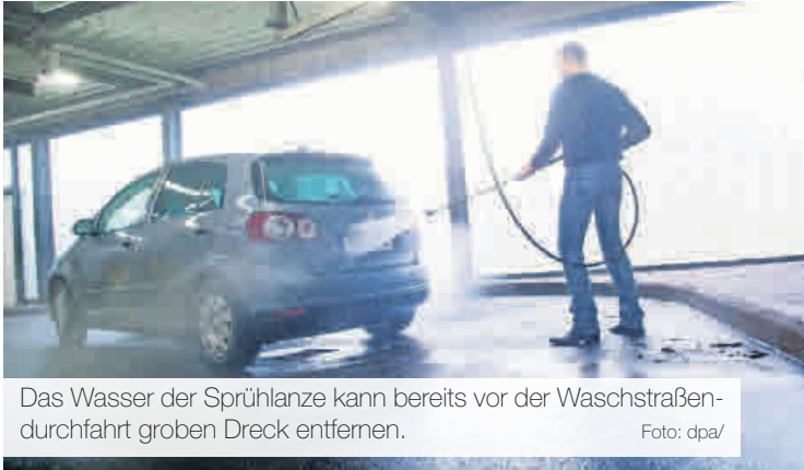
Das Wasser der Sprühlanze kann bereits vor der Waschstraßendurchfahrt groben Dreck entfernen.