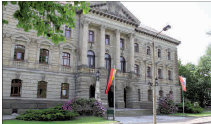
Das Hauptverwaltungsgebäude in der Lindenastraße in Altenburg