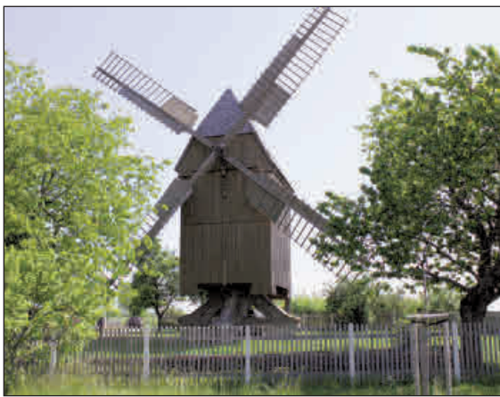
Die Bockwindmühle in Lumpzig ist die letzte erhaltene des Altenburger Landes

Landkreis. Die Bockwindmühle in Lumpzig ist am Pfingstmontag, den 5. Juni, Eröffnungsort des 24. Deutschen Mühlentages, einem Aktions- und Thementag rund um das Mühlenwesen in der Bundesrepublik. Dieser besondere Tag wurde von der Deutschen Gesellschaft für Mühlenkunde und Mühlenerhaltung ins Leben gerufen und findet jährlich am Pfingstmontag statt. Ziel des Mühlentages ist es, zusammen mit dem Denkmalschutz die alte Kulturtechnik des Müllerns wieder in das Bewusstsein der Bevölkerung zurückzubringen und die Mühlen als technische Denkmäler zu begreifen und zu erhalten. Hierfür sind am Mühlentag bundesweit über eintausend teilnehmende Wind- und Wassermühlen für Besichtigungen und Führungen geöffnet und als funktionierendes technisches Denkmal zu erleben. Eröffnet wird der Deutsche Mühlentag im-