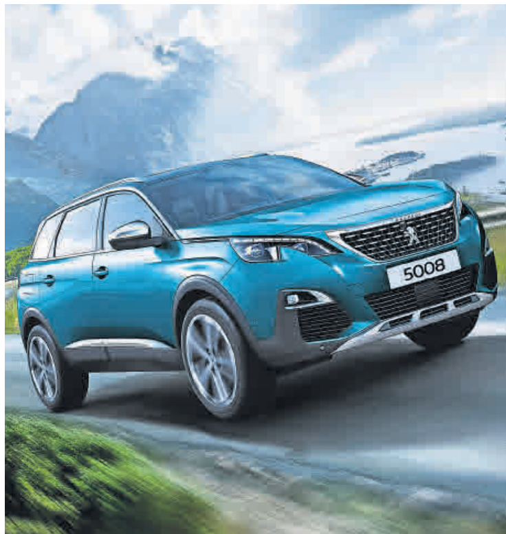
Größe zeigen: der Peugeot 5008.

Große Ehrung für ein überragendes Kraftfahrzeug: Der neue Peugeot 3008 ist zum „Auto des Jahres 2017“ gewählt worden. Die Jury aus 58 europäischen Journalisten hat insbesondere das Erscheinungsbild, das Innenraumdesign und das Gesamtkonzept des Autos gewürdigt. Der 3008 ist damit das erste SUV in der Geschichte des Preises, der zum Auto des Jahres gekürt wurde. Zu sehen ist das Modell bei der Autohaus Jähler GmbH. Das kraftvoll-gestreckte Design des neuen Peugeot 5008 SUV beeindruckt auf den ersten Blick. Die elegante Silhouette, das schwarze Black-Diamond-Dach sind die raffinierten i-Tüpfelchen einer beeindruckenden Erscheinung. Dank seiner leistungsfähigen Pure Tech- beziehungsweise Blue HDI-Motorisierungen, des Sechs-Stufen-Automatikgetriebes EAT6 sowie des optimierten Fahrzeuggewichts läutet Peugeot eine neue Ära effizienter SUVs ein.