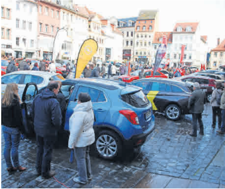
Der Altenburger Autofrühling hat sich längst etabliert und ist immer gut besucht – wie hier im Vorjahr.