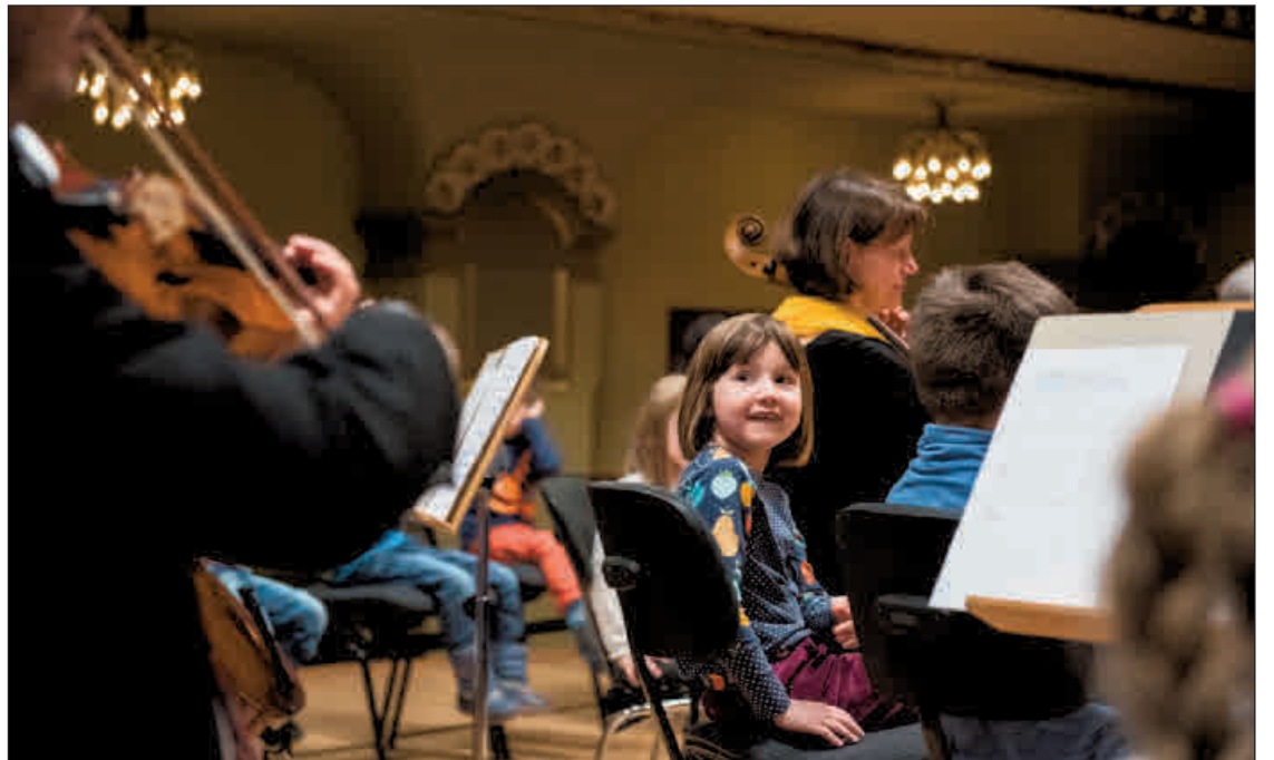
Insbesondere Kinder sind eingeladen, einmal mitten im Orchester an der Seite der Musiker zu sitzen.

Ab 12 Uhr werden verschiedene Workshops z. B. für erste Schauspiel-