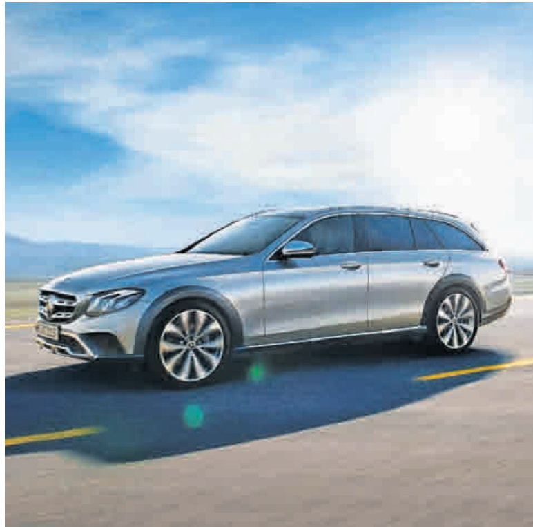
Der All-Terrain besitzt viel Bodenfreiheit.

Die Auto-Scholz-AVS GmbH & Co. KG stellt die neue Mercedes-Benz E-Klasse All-Terrain vor. Das Modell verkörpert die Kombination aus bewährter E-Klasse-Funktionalität und dynamischen SUV-Merkmalen wie Allrad Antrieb 4-Matic und Luftfederungssystem Air Body Control mit Verstell-dämpfung für Abrollkomfort und Fahrdynamik. Ein eigenes All-Terrain Fahrprogramm passt ESP und ASR an das jeweilige Gelände an und schafft in Kombination mit dem 4-Matic Antrieb zuverlässige Traktion und Vortrieb. Mit 121 bis 156 Millimeter Bodenfreiheit besitzt der All-Terrain deutlich mehr Distanz zum Boden als die normale E-Klasse. Design-Highlights sind die Kühlerverkleidung im SUV-Stil, robuste Anbauteile und große Leichtmetallräder.