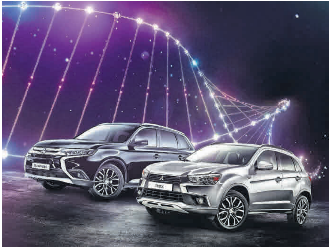
Überall perfekt unterwegs: Der Mitsubishi Outlander (links) und der ASX.

Autohaus Wiesner aus Selka stellt aus diesem Anlass die Sondermodelle der Edition 100 vor