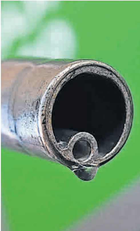
Der falsche Sprit im Tank kann böse Folgen haben.

Falscher Kraftstoff und seine Folgen: Wie sich Schäden vermeiden lassen