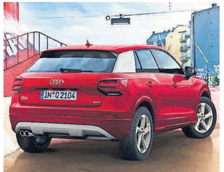
Der urbane Audi Q2 betritt die Bühne.

rein elektrisch und völlig emissionsfrei mit einer Reichweite von bis zu 160 Kilometern. Zu entdecken gibt es jetzt alles, was den neuen e-up! zum idealen Begleiter für jeden Tag macht.