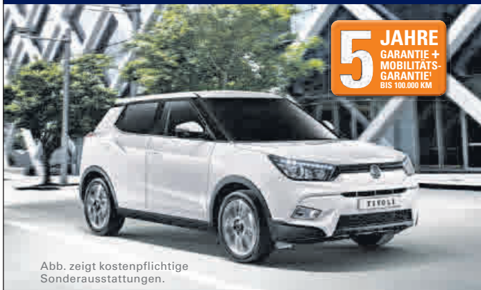
Abb. zeigt kostenpflichtige Sonderausstattungen.

Ein SUV mit vielen Talenten – auf und abseits der Straße.