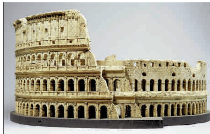
Korkmodell des Kolosseums;