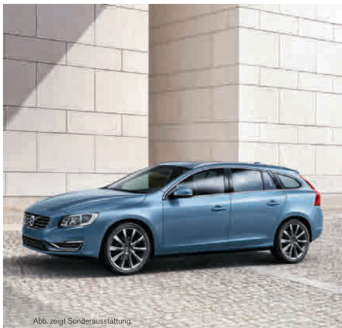
Abb. zeigt Sonderausstattung.