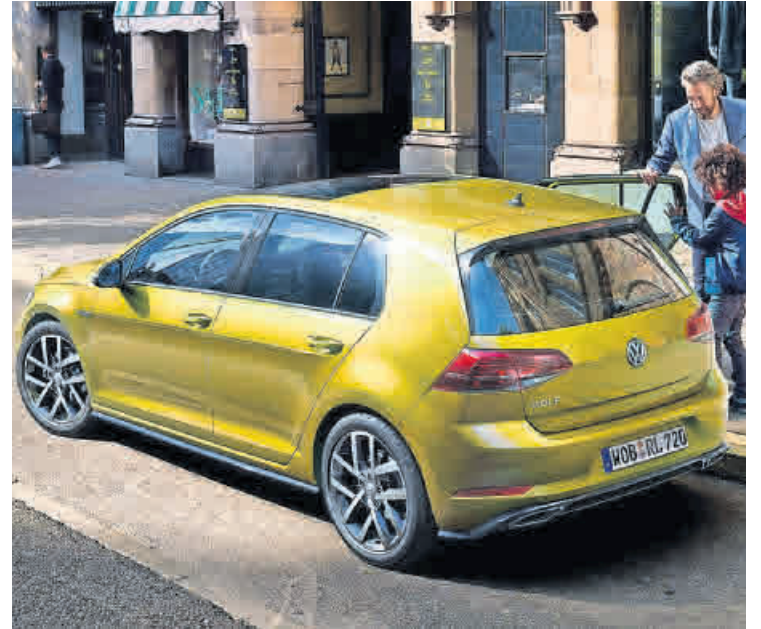
Der neue VW Golf ist für die Zukunft gerüstet.

Das Umfeldbeobachtungssystem Front Assist inklusive City-Notbremsfunktion mit Fußgängererkennung kann bei einem drohenden Auffahrunfall helfen, die Unfallschwere zu mindern oder – im Idealfall – den Unfall zu vermeiden. Es erkennt Fußgänger und Fahrzeuge auf der Fahrbahn und warnt den Fahrer rechtzeitig. Falls daraufhin nicht reagiert wird, leitet das Fahrzeug eine Notbremsung ein. Auf e-Mobilität umsteigen? Einfach einsteigen! Der neue e-up! macht's möglich. Sein leistungsstarker Elektromotor sorgt für jede Menge Fahrspaß – und das