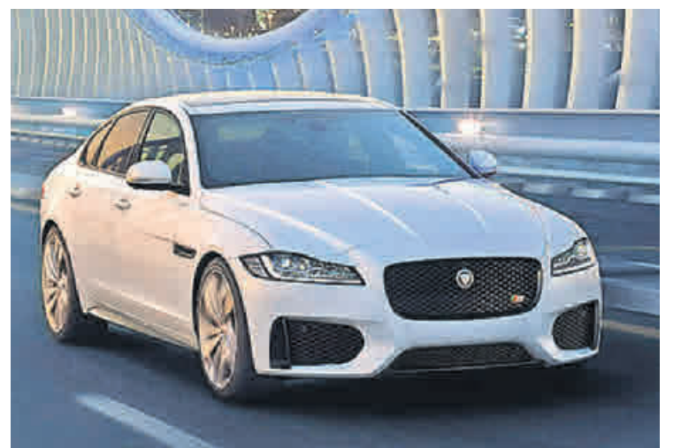
Der Jaguar XF zeigt viel Stil.

Handling, souveräner Fahrkomfort, ein hochwertiges Interieur und innovative Technologien der Spitzenklasse, gepaart mit hoher Alltagstauglichkeit und Effizienz. Sein kraftvoller Look macht ihn unverwechselbar und verleiht ihm eine aufsehenerregende Straßenpräsenz. Das Performance-SUV setzt ebenso wie sein Limousinen-Kollege mit Vollaluminium-Bauweise auf innovativen Leichtbau.