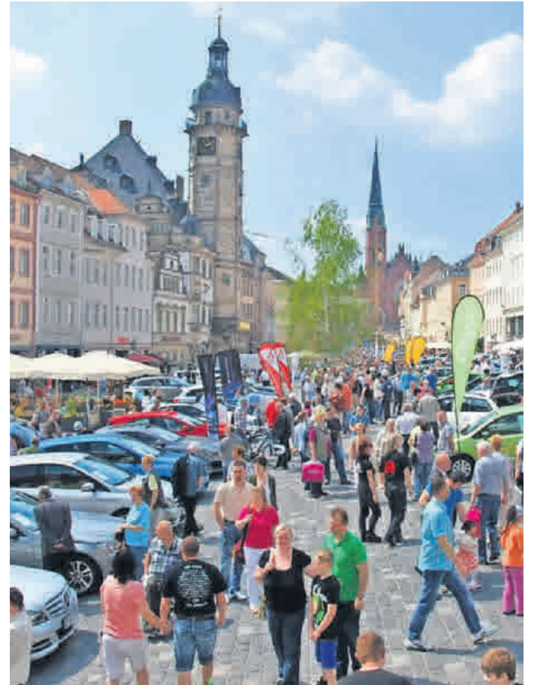
Fundgrube und Treffpunkt rund um das Thema Mobilität: der Altenburger Autofrühling.

➔ Mehr Informationen zum Thema Auto finden sich online unter www.kfz-innung-oth.de