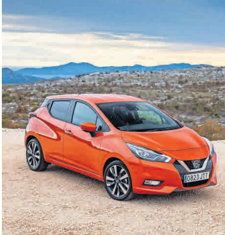
Flacher, breiter und länger als je zuvor – der neue Micra.

Autohaus Pöhland stellt die fünfte Generation des Nissan Micra vor