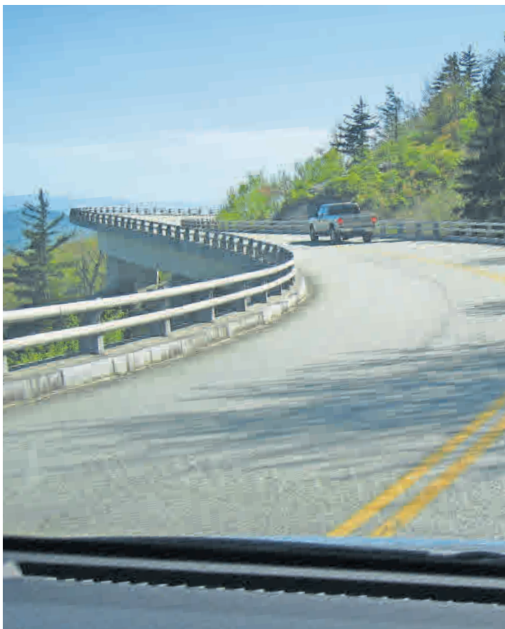
Fehler beim Autofahren im Ausland können teuer werden.

Seit 2010 dürfen Bußgelder aus den EU-Ländern in Deutschland eingetrieben werden