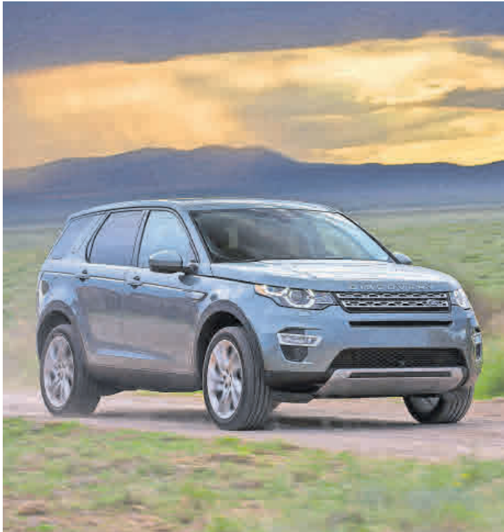
Der Land Rover Discovery.

Autohaus Reichstein & Opitz zeigt seine Premium-Marken Land Rover und Jaguar