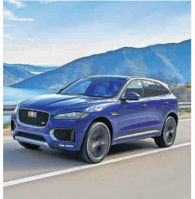
Der Jaguar F-PACE überzeugt als kraftvolles und elegantes SUV.

Mit Jaguar präsentiert Reichstein & Opitz Modelle, die atemberaubendes Design und beeindruckende Performance verbinden. Dem Jaguar XF gibt eine unvergleichliche Kombination aus Stil, Dynamik und Komfort seinen unverwechselbaren Charakter, der sowohl Fahrspaß als auch Effizienz bietet. Als beste Limousine in der Kategorie „Mittel- und Oberklasse“ wurde der XF zuletzt mit dem „Goldenen Lenkrad“ ausgezeichnet, dem bekanntesten deutschen Automobilpreis. Bei dem von Bild am Sonntag und Auto Bild ausgelobten Preis