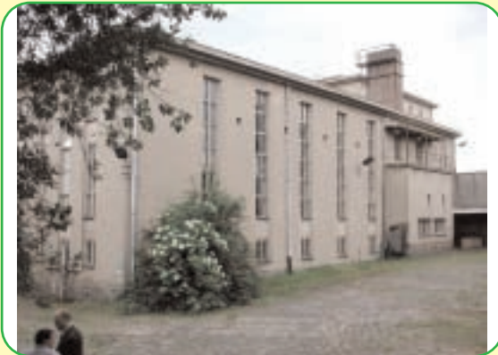
Die EWA GmbH bietet im "Wasserwerk Pleißenaue" die einmalige Chance eines Einblicks.