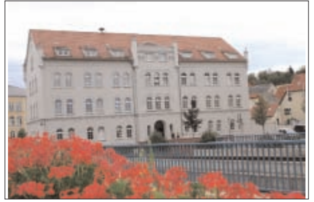
Im neu sanierten Gebäude Amtsplatz 8 befindet sich derzeit die Geschäftsstelle Schmölln der Volkshochschule Altenburger Land.

In den letzten Monaten gab es bei der VHS verstärkt Anfragen zum Erwerb eines "Computerpass". Ab sofort bietet das Lehrgangssystem "Europäischer Computer-Pass Xpert" diese Möglichkeit an. Es eröffnet den Teilnehmern auf Wunsch die Möglichkeit, auf europäischer Ebene anerkannte Zertifikate bzw. die Abschlüsse "European Computer Passport Xpert" bzw. "European Computer Passport Xpert Master" zu erwerben. Das Ausbildungssystem ist modular aufgebaut und bietet neben den Grundlagen der EDV und dem Internet u. a. auch die "Office"-Anwendungen, d.h. Textverarbeitung, Tabellen-