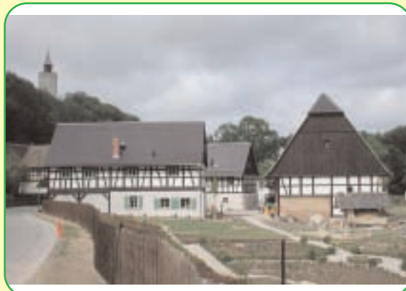
Der "Kunst- und Kräuterhof" in Posterstein hält nicht nur zum Denkmaltag interessante Angebote bereit.

Vorstellung verschiedener Handwerkstechniken, Tipps zur fachgerechten Schmuckreinigung,