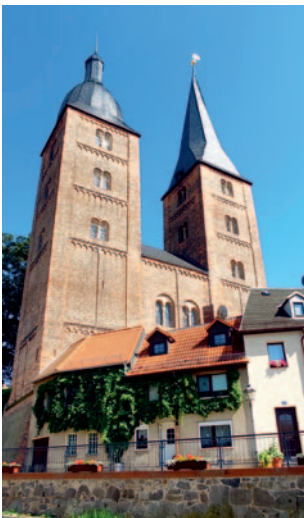
Die Roten Spitzen

Mit seiner reizvollen Hügellandschaft, idyllisch gelegenen Badeseen und gut ausgebauten Rad- und Wanderwegen bietet der Landkreis vielfältige Möglichkeiten der Erholung und Entspannung. Liebevoll restaurierte Vierseithöfe, traditionelle Feste und die Altenburger Mundart verleihen vor allem dem ländlichen Raum einen ganz besonderen Charme.