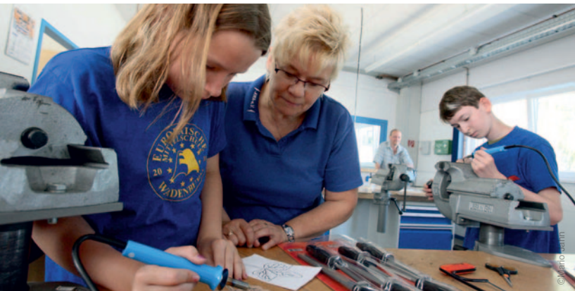
In vielen Fachrichtungen finden Absolventen direkt im Altenburger Land einen Ausbildungsplatz.