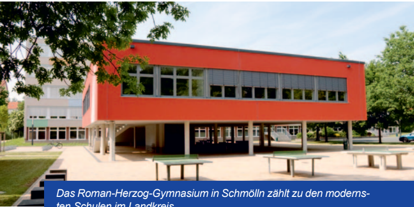
Das Roman-Herzog-Gymnasium in Schmölln zählt zu den modernsten Schulen im Landkreis.

Die wichtigste Voraussetzung, um Fachkräfte für die regionale Wirtschaft zu generieren, ist eine qualitativ hochwertige Bildung. Dafür steht im Altenburger Land ein dichtes Netz an Kindertagesstätten, Grund- und Regelschulen sowie Gymnasien zur Verfügung. Volkshochschule, Musikschule und verschiedene Aus- und Weiterbildungsinstitute sowie namhafte Universitäten und Hochschulen im Umkreis von etwa 50 Kilometern runden das Bildungsangebot ab.