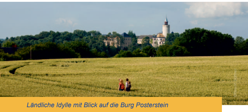
Ländliche Idylle mit Blick auf die Burg Posterstein