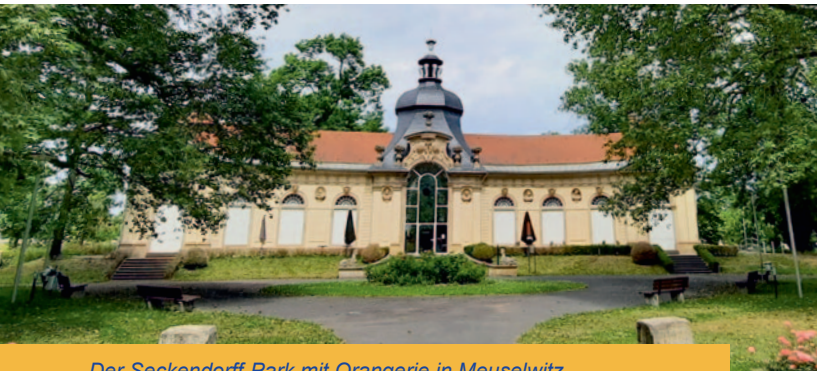
Der Seckendorff-Park mit Orangerie in Meuselwitz