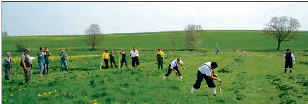
Seit zwei Jahrzehnten werden in Rositz bei den Futterschrotern die Schnellsten beim Mähen mit der Sense gesucht.

Zum 20. Mal mähen im Mai wieder Frauen und Männer in Rositz um die Wette