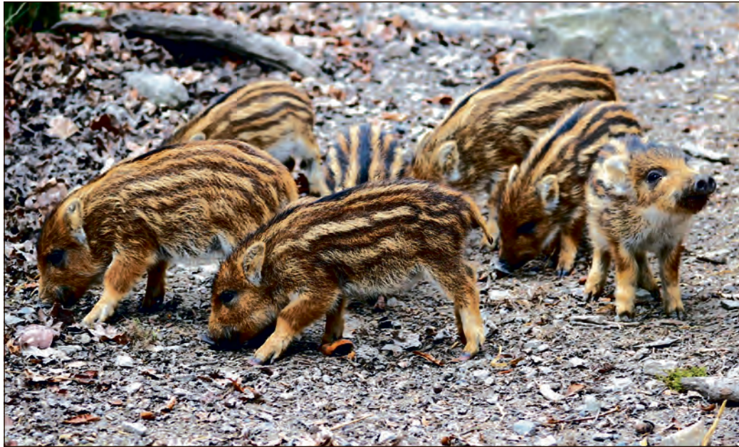
In den ersten Lebenswochen sind Frischlinge sehr verletzlich.

„Normalerweise legen Bachen die Wurfkessel dort an, wo sie ungestört sind und nicht auf Menschen treffen, also