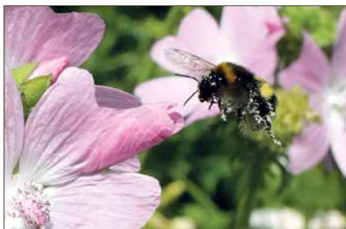
Eine Dunkle Erdhummel fliegt eine Rosen-Malve-Blüte an.