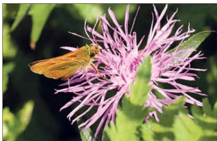
Der Dickkopffalter saugt den Nektar einer Wiesen-Flockenblume.