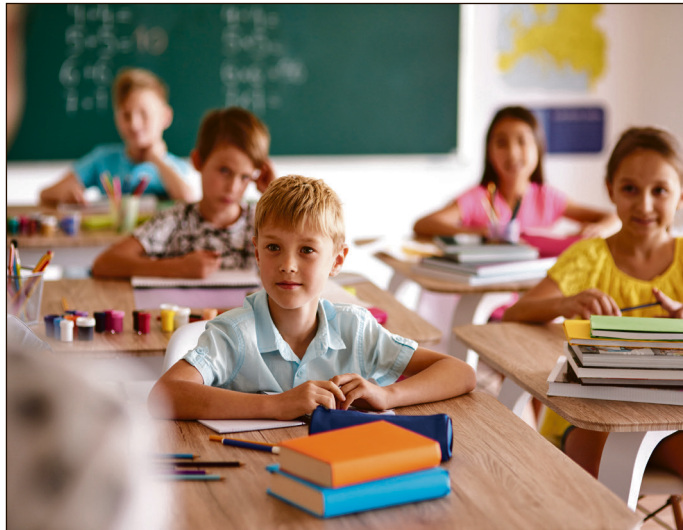
Ab Montag wird wieder die Schulbank gedrückt.

Landkreis. In Thüringen beginnt am Montag das neue Schuljahr. Im Altenburger Land werden dann rund 9.000 Kinder und Jugendliche nach den sechswöchigen Sommerferien wieder die Schulbank in den Grund- und Regelschulen, Gymnasien und Berufsschulen drücken.