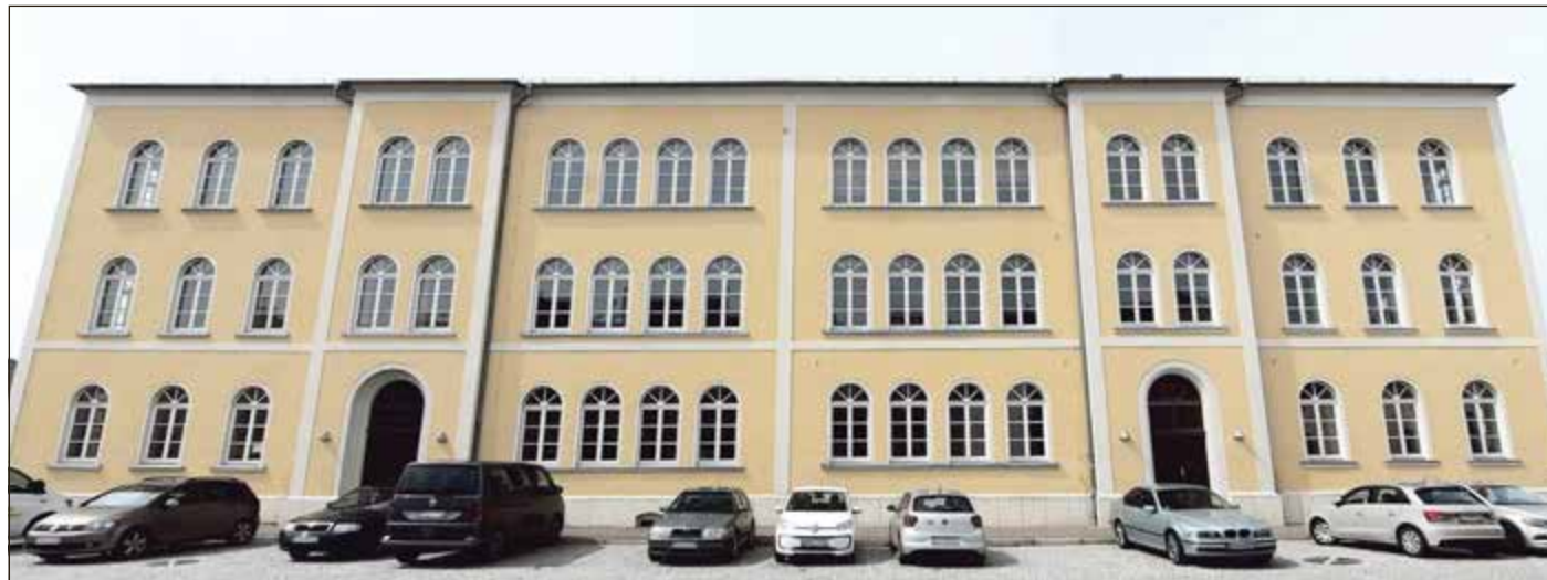
Während der Bauarbeiten wird das Parken vorm Gebäude nicht mehr möglich sein.

Umbauarbeiten werden in den kommenden zwei Jahren das Bild im Stadtzentrum prägen